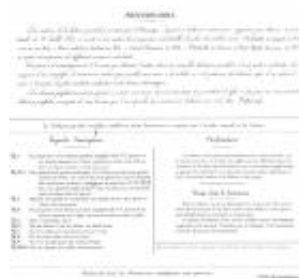
Illustration 3 (Périer, 1842)

Dans la vérification primitive, le vérificateur s'assure chez le fabricant de la bonne construction de la balance et de sa justesse. L'inspection individuelle des objets reste à étudier car les chiffres industriels ont dû demander un travail très important aux vérificateurs, comme, par exemple, pour les 14000 balances sortant annuellement de la seule Manufacture Catenot et Béranger en 1856 à Lyon. Il existait à l'époque une dizaine de concurrents, dont quatre de taille respectable (Tresca, 1861). Le vérificateur devait peut-être également se fier à une qualité reconnue de fabrication, à un prestige et à un mode de fabrication garantissant la standardisation des produits. L'individualisation du produit se fait ensuite dans un