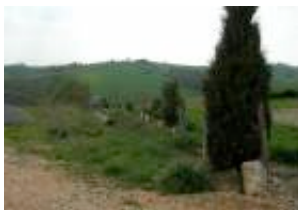
Illustration 4 Haie plantée à droite de la haie attenante. (Sourdril, 2004)