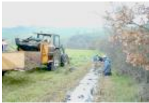
Illustration 5 Plantation d'une troisième haie en bordure de la haie existante. (Sourdil, 2004)

L'agriculteur en cause lui semble avoir compris l'avertissement de son voisin même s'il trouve ses façons de faire un peu rudes « bon on sait que les camions c'est pas commode mais, là un matin on arrive au poulailler et on voit cette rangée d'arbres, ils avaient été plantés la veille parce qu'ils y étaient pas encore y a quelques jours, alors ils auraient pu en parler avant de faire ça, bon depuis on a demandé aux camions de faire le tour, de plus passer devant chez eux comme ça y a plus de problèmes ». En réaction quelques temps après, ce dernier a lui-même planté une troisième haie en bordure de celle existante afin de signifier à son voisin du dessus qu'il était lui-même conscient de la limite qui séparait leurs deux propriétés (illustration 5).