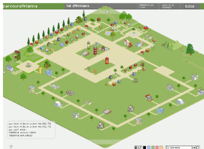
VIE est un exemple de milieu social dans lequel se constitue la vie d'une communauté virtuelle. Ci-dessus le village virtuel du parcoursArianna en Anniviers en partie configuré par les femmes du parcoursArianna .

Dès le début du projet, cette plateforme télématique était donc appelée à servir d'espace communautaire virtuel féminin [19], de lieu de rencontre et d'apprentissage. Du point de vue formel, ce modèle de plateforme représente un village virtuel que chaque communauté d'utilisatrices peut configurer à sa guise. Seules les formatrices, les participantes, les trois ou quatre chercheuses et le chercheur [20] travaillant sur le projet y avaient accès, par l'intermédiaire d'avatars [21] choisis parmi une multitude de personnages à disposition. Cette