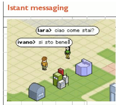
Échange sur la plateforme en mode « communication instantanée » par l'entremise des avatars.

Enfin, un quartier était réservé aux chercheuses et au chercheur liés au projet afin qu'il et elles puissent rendre accessibles leurs travaux, articles et autres commentaires. Un appel à l'interaction qui fut bien peu exploité, principalement à cause des scientifiques, force est malheureusement de l'admettre.