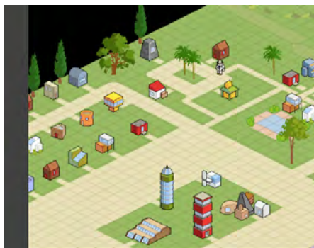
Avatar de l'auteur sur la plateforme Arianna devant sa "cabane" du quartier des chercheurs

Hormis l'apport pour le moment peu convaincant du numérique pour les actrices de ma recherche, les aspects bénéfiques du parcoursArianna sont pourtant loin d'être négligeables, comme je l'ai montré ailleurs (Amrein 2007a, 2007b). Parmi les aspects positifs de cette expérience dans le Val d'Anniviers, je relèverai pour conclure un phénomène quelque peu paradoxal qu'il s'agit de mettre en relation avec l'importance accordée dans la didactique de la formation aux échanges permanents entre participantes : l'apprentissage en commun des techniques de communication "à distance" semble avoir surtout eu pour effet de renforcer les liens de proximité entre des femmes qui en avaient parfois perdu l'habitude, d'avoir créé des amitiés entre celles qui ne se connaissaient pas auparavant et, à défaut d'avoir multiplié les rencontres virtuelles, d'avoir encouragé les relations "en présence" entre des habitantes de la vallée qui ont partagé durant deux ans l'aventure du parcoursArianna .