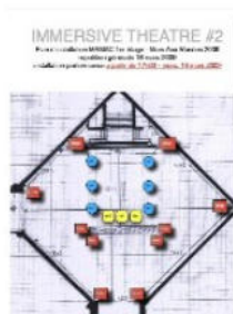
Immersive Theatre #2 - Mamac (document complet)

Le lieu dans lequel est effectuée la performance a une forme hexagonale et est coupé en deux parties (2/3-1/3) par un mur. Le dispositif est composé de 10 enceintes réparties circulairement dans l'espace. L'espace de captation est délimité dans l'espace 2/3, par 6 microphones sur pieds. Il y a deux musiciens, l'un pour le traitement en temps réel, l'autre pour la spatialisation. Ils sont situés au pied du mur de séparation, face à l'espace de captation dans lequel évolue le corps-performer. Il n'y a pas dans cette configuration un espace de visibilité et un espace d'invisibilité ; l'ensemble de la salle est éclairé, seul l'espace correspondant à celui des captations a une lumière renforcée. L'espace de diffusion du son immerge le public en l'encerclant mais ne se confond pas avec l'espace de captation.