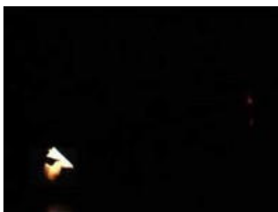
Immersive Theatre (séquence video)

Le dispositif d' Immersive Theatre #2 n'est donc pas encore abouti. Plusieurs questions sont encore en suspens, particulièrement par rapport aux modalités d'immersion du spectateur. Comment penser l'immersion ? Comment la concrétiser à l'intérieur d'une expérience esthétique ? Du point de vue du fonctionnement de la perception, le rapport entre la vision et l'ouïe peut être conflictuel. Cela implique d'inclure dans l'écriture chorégraphique un équilibre entre la présence visible du corps dansant et sa présence audible. Pour cette raison, un travail de lumière et de scénographie va être initié. Le choix est celui de l'obscurité, une lumière très basse grâce à laquelle le corps-performer n'est visuellement perceptible que comme trace évanescence, fragile. De plus, la lumière devient un élément actif dans l'écriture de la corporéité en tant qu'elle définira des spatialités dans l'espace scénique : espaces éclairés, espaces obscurs à l'intérieur desquels le corps-performer naviguera. La danse se déroulera par-delà la visibilité. Elle sera présente à l'intérieur de la multiplicité des espaces du visible, de l'invisible, du sonore et du silence. Je cherche à créer des jeux de relais entre tous ces espaces et ces corps, corps-performer, corps-son [12].