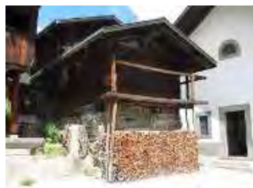
Ill. 2 : Un raccard sur la place du village de la commune de Ferden, Lötschental

Werner Bellwald, spécialiste valaisan d'ethnologie régionale, est sans doute le premier à avoir signalé combien il était difficile pour les personnes extérieures de se faire une représentation réaliste du système socio-économique traditionnel structurant les communautés paysannes de montagne. Dans la phrase citée ci-dessus, il se limite dans un premier temps à décrire la perception visuelle des touristes et des chercheurs qui visitent l'une des hautes vallées du Valais, le Lötschental. Pourtant l'expression « scènes pittoresques » laisse entendre que les suppositions d'homogénéité socio-économique des étrangers recouvrent bien davantage qu'une simple suite de perceptions gestaltistes globales et unitaires. Il est bien plus probable que les mondes du travail des paysans de montagne et les ensembles architecturaux du Lötschental n'aient été que les objets sur lesquels les