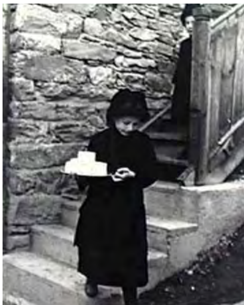
Ill. 9 : Retrait du « Spendziger » lors de la « Osterspend » dans la maison communale de Ferden.

préparation dispendieuse et sa réalisation cérémonielle, avait, aux yeux des gens de Ferden, la fonction d'atténuer les tensions. Compensation à la fois symbolique et matérielle, elle serait en quelque sorte un contrepoids aux inégalités sociales existant entre les gens de Ferden et les autres habitants et habitantes du Lötschental solennellement invités par les donateurs (Spendherren) à la distribution pascale (Osterspend). » Dans cette forme de réciprocité, il voit un parallèle entre les revenus matériels que le système de fermage rapportait aux propriétaires (Lehnsherren) de Ferden et la distribution symbolique de denrées alimentaires par les donateurs de Ferden.