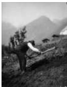
Ill. 1 : Un paysan du Lötschental dans son champ.

« Qu'il y ait des différences essentielles dans l'étendue des champs sur lesquels s'activaient - comme des archétypes populaires - ces paysans, tous vêtus de même et tous travaillant de la même façon ; que ce raccard abrite le blé d'un seul paysan, alors que plusieurs propriétaires se partageaient le raccard suivant à raison de 1/16e, 1/32e ou même 1/64e, personne, avec la meilleure volonté du monde, n'aurait pu le deviner en voyant ces scènes pittoresques. » (Bellwald, 1997 : 139)