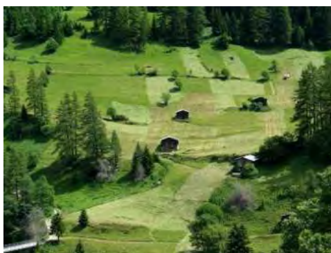
Ill. 11 : A l'époque de la fenaison la structure en parcelles des prés se dévoile brièvement