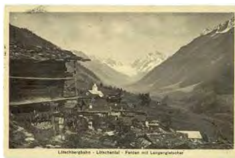
Ill. 5 : carte postale avec vue de Ferden, env. 1920

Nous voilà arrivés au bout de ce bref aperçu des grands axes de la recherche historique sur le Lötschental et des modèles sociaux utilisés pour déterminer l'appartenance et l'homogénéité ou la non-homogénéité sociales. Je me propose maintenant de présenter les sources recueillies sur les structures socio-économiques de la communauté villageoise avant 1950 dans la commune qui a fait l'objet de mes recherches : Ferden dans le Lötschental (ill. 5). [5]