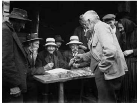
Ill. 7 : Les comptes d'alpage de la Kummenalp dans la commune de Ferden.

Ferden, c'était l'endroit où les gens ont gagné de l'argent et où ils étaient riches. Je dirais que, pour leur condition, les gens de Ferden étaient certainement les plus riches. C'est pourquoi on disait les riches de Ferden avec leurs grands chapeaux, ils avaient de l'argent et le montraient aussi probablement, avant aussi. »