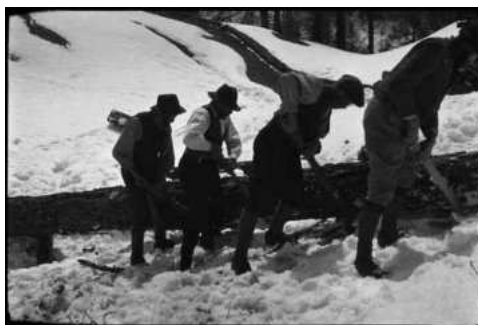
III. 4 : Portage collectif du bois en hiver.

Les enquêtes d'anthropologie sociale des années 1970, inspirées par l'anthropologie culturelle américaine et utilisant les nouvelles méthodes des sciences sociales, ont analysé les profonds changements qui ont affecté le Lötschental depuis la Seconde Guerre mondiale. [4] Entre une société agraire fonctionnant pratiquement sans numéraire et une société moderne invasive avec ses biens de consommation (les paysans devenus en même temps ouvriers formant une nouvelle catégorie socio-économique et disposant de nouvelles possibilités de revenus et formes de mobilité), la différence était si grande qu'elle a occulté les différences potentielles de fortune existant entre les habitants du Lötschental. A la suite du diagnostic posé par Richard Weiss sur la crise structurelle des régions de montagne, la résistance à l'innovation, le changement de valeurs, les phénomènes de retard socio-économique se trouvaient au centre des préoccupations (Weiss, 1957 : 209-224). Ce qui a favorisé, dans le discours des spécialistes, l'apparition d'une nouvelle dichotomie opposant l'espace rural à l'espace urbain comme s'il s'agissait de deux entités sociales types. Tout à l'étude de cette différence, les scientifiques ont présenté les communes de montagne comme s'il s'agissait de cas d'étude en soi homogènes et ont négligé toute observation différenciée des sociétés villageoises.