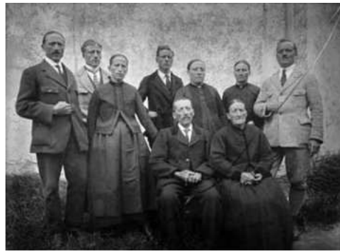
Ill. 8 : Photographie d'une famille de Ferden.