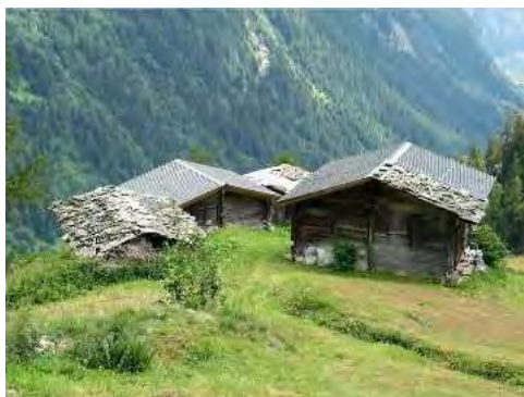
Ill. 12 : Des granges-écuries et leurs toits constitués de matériaux disparates