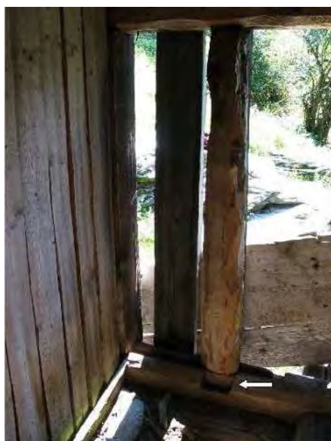
Ill. 13 : Echancrure faite au pied d'une paroi de séparation dans le seuil de la porte d'une grange-écurie et témoignant de la petitesse de la partie du bâtiment possédée