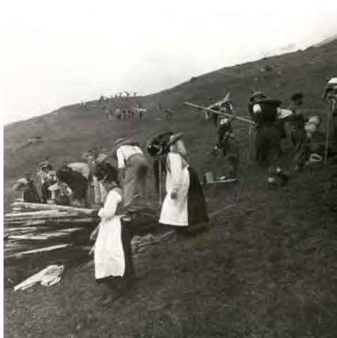
Ill. 3 : Portage du bois sur la Lauchernalp, 1936.