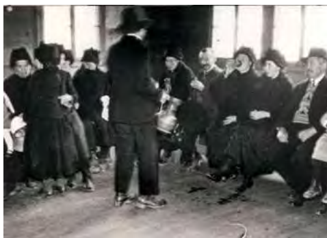
Ill. 10 : Distribution de vin lors de la « Osterspend » dans la salle de la bourgeoisie de Ferden, années 1930.