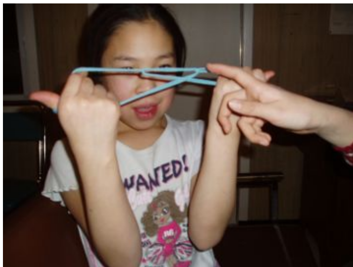
Jeunes filles d'Iglulik jouant au jeu de ficelle de « la bouche », Arctique oriental canadien, 2006.

régions inuit, et notamment dans l'Arctique oriental canadien, où cette figure — désignée comme la « bouche », qanirjuk [9], — est l'une des plus communément réalisées de nos jours.