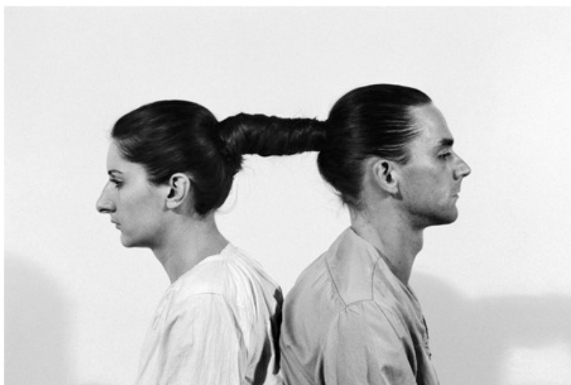
Extraction de la performance de Marina Abramovic et Ulay, Relation In Time , 1977 ( https://www.youtube.com/watch?v=1sRSOGAc3H0 )