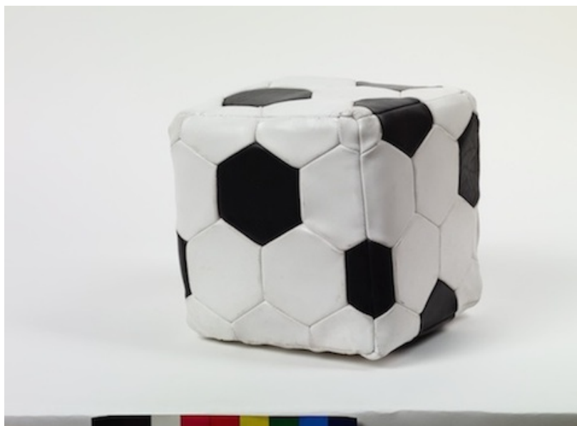
Fabrice Hyber, POF n°65 : ballon carré, cuir, 20,5x20,5x20,5 cm, 2008.

Dans ce régime du projet , les artistes peuvent être sollicités par de grandes entreprises pour sublimer des objets en œuvres d'art. Depuis 1975, la firme BMW a débuté une collection de Art Cars en faisant appel à des artistes mondialement reconnus tels que David Hockney, Jenny Holzer, Roy Lichtenstein, Frank Stella, Robert Rauschenberg, ou encore Andy Warhol. Quand l'artiste se fait entrepreneur d'objets, le travail de la main et du corps le cède à celui du concept, rejoignant le modèle de production industrielle. Parmi tant d'autres, on peut relever la réflexion, menée depuis 1991, par Fabrice Hyber qui crée des POF (Prototypes d'Objets en Fonctionnement), objets issus de notre quotidien mais dont la forme et/ou la fonction sont détournées de manière à ouvrir l'horizon de l'objet : le ballon carré, l'escalier sans fin, etc. Comme le dit F. Hyber lui-même : « À la différence d'un prototype industriel, le POF aborde la méthode de fabrication et devient peu à peu un mode d'emploi ». Pour lui, l'œuvre est une « prothèse mentale qui prolonge la pensée par le corps » ainsi qu'une « entreprise mettant en réseau des individus, des idées et des savoir-faire » [6].