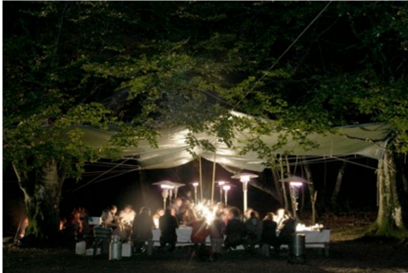
Il manque les coups de feu , 2003. Centre d'art « La Chapelle Saint Jacques ».

Mais l'interrogation sur le quand de l'artiste tend de plus en plus à se situer vers l'aval de l'œuvre, dans le réseau des expositions, des institutions et des acteurs économiques au sein duquel elle est saisie avec son auteur. L'artiste n'a plus seulement à faire l'œuvre ; il doit également faire l'artiste puisque « faire l'œuvre » ne lui appartient plus entièrement.