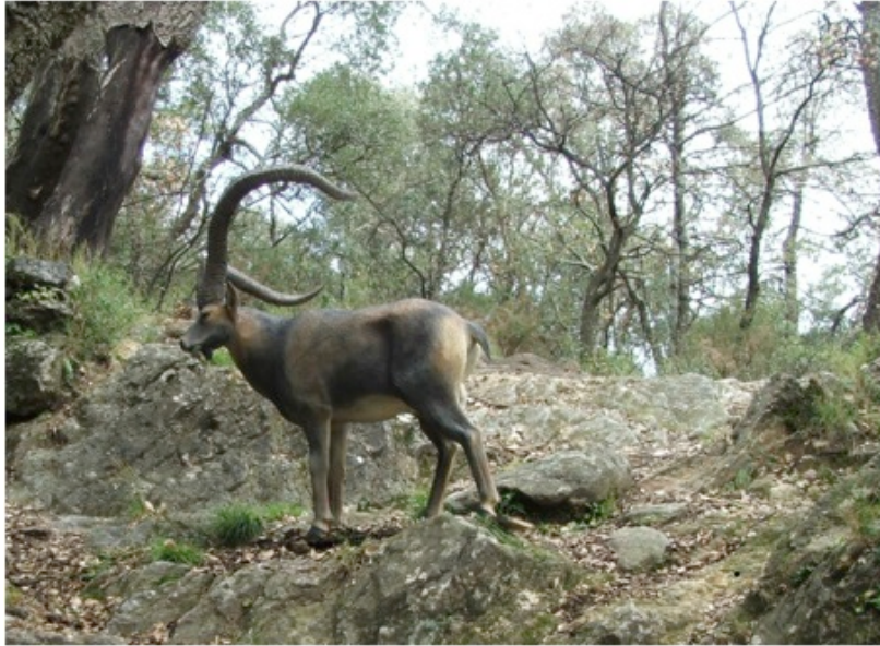
Cible de tir ARAWAK.

En 2010, j'ai eu l'idée de mettre à profit le savoir-faire d'un fabricant de cibles de tir à l'arc qui est connu dans le milieu des archers français, et surtout de ceux qui pratiquent la discipline du parcours dit « nature ». Il s'agit de compétitions de tir à l'arc en milieu naturel aménagé comportant des cibles représentant des animaux en 3D. La plupart de ces cibles sont de fabrications industrielles, de formes assez grossières coulées dans des moules. Mais, pour certains parcours, on trouve des cibles d'une qualité bien supérieure et qui s'éprouve en situation : à 30 mètres ou 15 mètres, l'effet de la cible est si saisissant qu'on a l'impression de voir un animal véritable. Fréquentant ce milieu du tir à l'arc épisodiquement, je connaissais la réputation de l'artisan pyrénéen, Jean, qui est le responsable de cette « réception de magie » et lorsque l'occasion se présenta je lui passais une première commande.