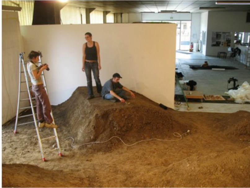
Fabrication de l'œuvre Poétique de la bosse avec des étudiants de l'École des Beaux-Arts de Toulouse, Galerie le BBB, 2008.

Dans la phase de production, il peut m'arriver de fabriquer moi-même l'œuvre mais jamais sans l'aide d'assistants, étudiants en écoles d'art par exemple. Il est alors question de transmission des savoirs ou plus exactement de cet « apprentissage par imprégnation » dont parlaient Geneviève Delbos et Paul Jorion (1984). Les futurs artistes ne se voient pas délivrer dans ces situations un cours sur l'art. Ils ne sont pas davantage dans le cadre d'un apprentissage direct de techniques artistiques (« la recette pour faire une œuvre » en somme) puisque l'essentiel a eu lieu avant. Mais ils acquièrent dans cette implication en qualité de main d'œuvre l'expérience intransmissible autrement des conditions de la production d'une œuvre, de la complexité des rapports entre l'artiste et un environnement naturel, social, politique, économique. C'est finalement l'accès à une vision pragmatique de la figure de l'artiste contemporain, confronté à la réalisation d'une œuvre.