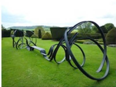
Pablo Reinoso, Huge Sudeley Bench , 2010. Consultable en grand format sur le site de l'artiste : Pablo Reinoso

Inversement, c'est au cœur de la logique la plus ordonnée, celle de l'objet fonctionnel, que Pablo Reinoso institue la tentation du désordre dont l'objet est le point de départ ; comme un déraisonnement de l'objet par la nature et l'aléatoire des formes qu'elle propose.