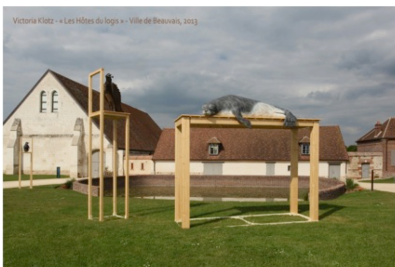
Les Hôtes du logis. Installation in situ pour la Maladrerie Saint-Lazare (Beauvais). 11 éléments en bois et mousse polyéthylène.