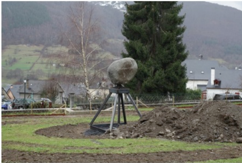
Chantier du Jardin des délices , Arras en Lavedan, 2015. Conception de la structure, entreprise Pyrénées Concept (65).

C'est la phase délicate ; le moment où se négocie l'accord des mains . Celle-ci franchie, la discussion peut alors porter sur le défi technique à relever ensemble. L'accord de l'expert en somme. Comment faire, par exemple, pour que ce rocher de granit paraisse posé là, en déséquilibre flagrant, dans le respect de la sécurité publique et avec un système de fixation invisible ? C'est la résolution de ce type de difficulté qui me lie aux artisans avec lesquels je travaille. Je dirais ainsi que l'action artistique se situe fondamentalement dans une « réception de magie » — qui peut être simplement la qualité d'un simulacre, ou aller jusqu'à la performance qui relève de la prestidigitation. J'ai pu expérimenter à plusieurs reprises que le public recevait l'œuvre comme un « tour » (« il y a un truc ! ») à la réussite duquel contribue le tour de main mais qui n'en est pas l'élément central. Je me suis peu à peu appropriée cette « réception de magie » pour en faire une « intention de magie » que j'assume et qui m'est utile à l'occasion de mes discussions avec les artisans.