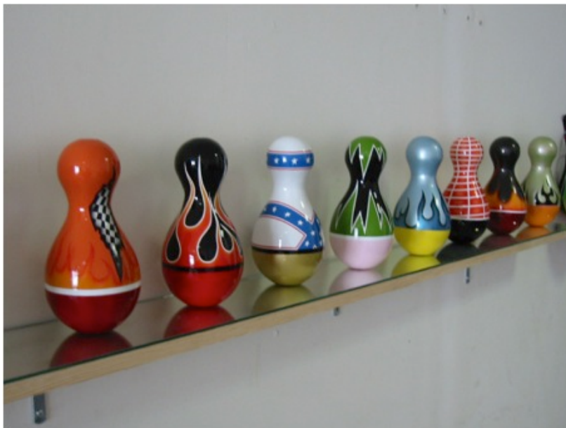
Lionel Scoccimaro, sans titre, 2003. 18 pièces uniques, Résine polyester et peinture de carrosserie, 30x12x12cm. Vues générales de la FIAC, galerie Alain Legailard, Paris. © ADAGP, Paris, 2015.