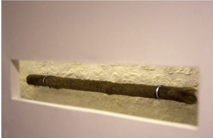
Détail de l'installation Le bureau de l'écologue : « La main courante ».

Dans les deux cas, c'est la métaphore cynégétique qui parle : suivre l'animal, se laisser guider pour mieux l'imiter ou le leurrer. La chasse comme thème transversal qui se retrouve ailleurs dans plusieurs de mes œuvres. Sans doute, est-ce une activité à travers laquelle se rejoue en quelque sorte une tension plus générale que l'on peut dénicher dans de nombreux domaines de la vie sociale et à laquelle l'art contemporain n'échappe pas et que, peut-être, il travaille d'une manière toute spécifique. C'est celle qui se joue entre les parts de maîtrise et de surprise qui œuvrent à la réalisation de toute situation. Tout champ de la vie sociale peut probablement se décliner selon les degrés relatifs de maîtrise et de surprise réservés à son traitement. La chasse dramatise les situations de la vie ordinaire : on recherche la maîtrise (on tend des pièges, on fait des leurre, on s'exerce, etc.) mais il y a toujours un hasard qui résiste (un poisson têtu, quelque chose qui ne prend pas sans explication, etc.). La pratique des arts plastiques, comme l'avait bien souligné Francis Bacon (1996 : 71), permet de schématiser et de travailler ces situations : on y choisit et on y questionne les doses de maîtrise et de surprise qui construisent le processus créateur [5].