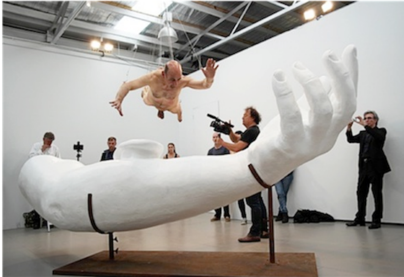
Stelarc, Ear on Arm Suspension . © Polixeni Papapetrou, 2012.

D'autre part, au brouillage de la frontière entre fabrication et circulation s'ajoute celui, plus général, non singulier à l'art contemporain mais prenant ici un relief particulier, des bornes du processus artistique lui-même. Comment et à partir de quel point l'idée prend-t-elle forme [4] ? À quel stade s'échoue-t-elle dans, ou est-elle délivrée du processus créateur ? Et pour se rendre dans quel(s) autre(s) monde(s) si ce ne sont ceux de l'art ? Dans quelle mesure ce processus peut-il s'exercer, et dès lors être décrit et interprété, hors du plasma de la vie quotidienne ? Christian Boltanski se plaisait ainsi à répéter, au début des années 1980, qu'il aurait souhaité que l'on entrât dans son atelier sans être capable de distinguer immédiatement les œuvres en cours, celles abandonnées et remises, et les objets de la vie de tous les jours. De même, autour du bureau où j'imagine mes œuvres, il y a un arc dans son étui, des corbeaux en plastique, une plage arrière de voiture, une main en bois articulée et la sculpture d'un chimpanzé somnolent !