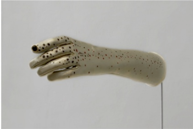
Gants truités. Paire de gant en cuir d'agneau, impression dorée avec motifs. Produit en collaboration avec la maison Causse Gantier, Millau. © Victoria Klotz, 2011.

La dernière de mes œuvres qui constitue une référence directe à la main s'intitule « La main courante ». Elle fait partie d'une installation muséale, qui est une fiction d'un bureau de recherche en éthologie. La main courante est recouverte de fourrure de cerf imprégnée de phéromones de cervidés. Elle est fixée au mur, mettant ainsi à disposition du public la fonction par laquelle elle est désignée. Non plus faire venir l'animal à soi, mais être guidé par lui.