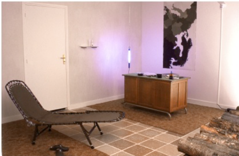
Le bureau de l'écologue, installation-vidéo. Galerie municipale, Sarlat, 2001. © Victoria Klotz, 2001.

La dernière de mes œuvres qui constitue une référence directe à la main s'intitule « La main courante ». Elle fait partie d'une installation muséale, qui est une fiction d'un bureau de recherche en éthologie. La main courante est recouverte de fourrure de cerf imprégnée de phéromones de cervidés. Elle est fixée au mur, mettant ainsi à disposition du public la fonction par laquelle elle est désignée. Non plus faire venir l'animal à soi, mais être guidé par lui.