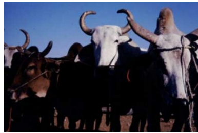
Illustration 4 Des vaches. (Titus, été 1995)