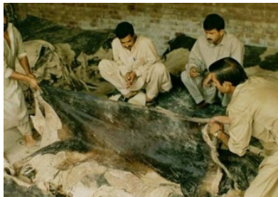
Illustration 11 Des marchands examinent des peaux à Kasur. (Titus, été 1995)