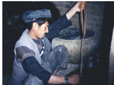
Illustration 14 La préparation des boyaux. (Titus, été 1995)