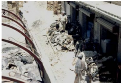
Illustration 9 Un chargement de peaux destinées à Kasur. (Titus, été 1995)