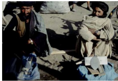
Illustration 3 Travailleurs réfugiés à Quetta. (Titus, été 1995)