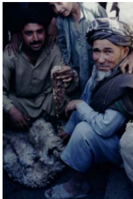
Illustration 13 Peaux et intestins de mouton mis en vente. (Titus, été 1995)