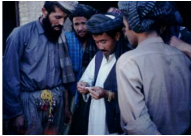
Illustration 7 La mise aux enchères d'une peau. (Titus, été 1995)