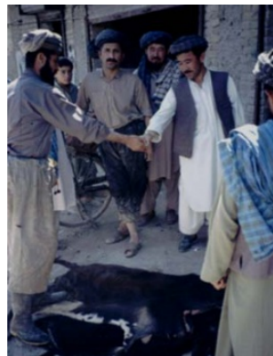
Illustration 6 La mise aux enchères d'une peau. (Titus, été 1995)