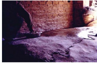
Illustration 8 La préparation des peaux. (Titus, été 1995)