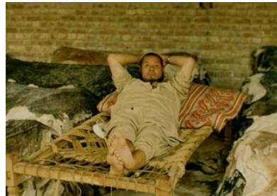
Illustration 10 Marchand de peaux uzbek à Kasur. (Titus, été 1995)