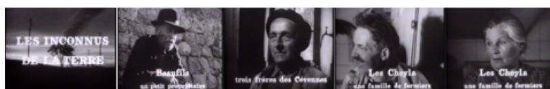
Le casting des « Inconnus de la terre », 1961 (1/2)