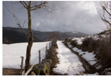
Chemin près de Grizac, le lieu des trois frères célibataires des Inconnus de la terre