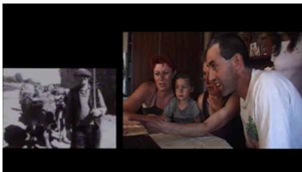
Lors du premier repérage en 2008, séance de visionnage à Espère, hameau au dessus de Saint-Léger-de-Peyre