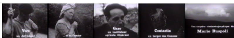
Le casting des « Inconnus de la terre », 1961 (2/2)

Le casting des « Inconnus de la terre », 1961