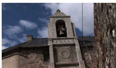
L'église de la Villedieu, paroisse du père Bancillon, 2011

L'église de la Villedieu, paroisse du père Bancillon, 1961, (les "Inconnus de la terre", Argos)