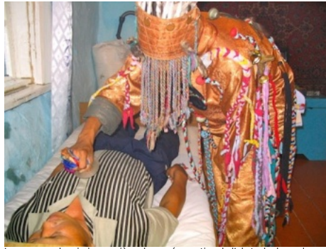
La cure avec le miroir, première phase : évacuation de l'obstacle doora du corps du patient. Touva, Kara-Chyraa, 2004.