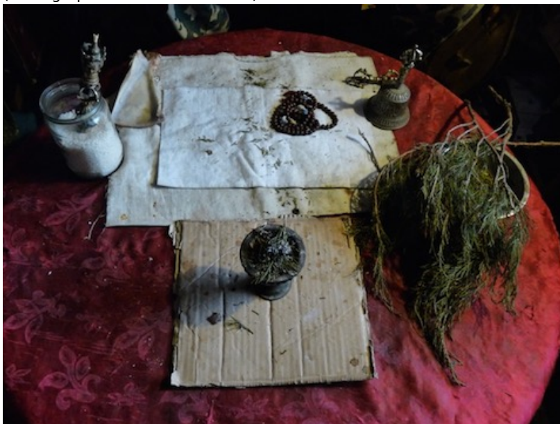
Fig. 3. Outils rituels chamaniques et bouddhiques d'un chamane altaïen (de gauche à droite) : une dague phurba , une omoplate de mouton, un chapelet, une cloche et un diamant vajra , ainsi que des branches de genévrier à brûler pour la purification.