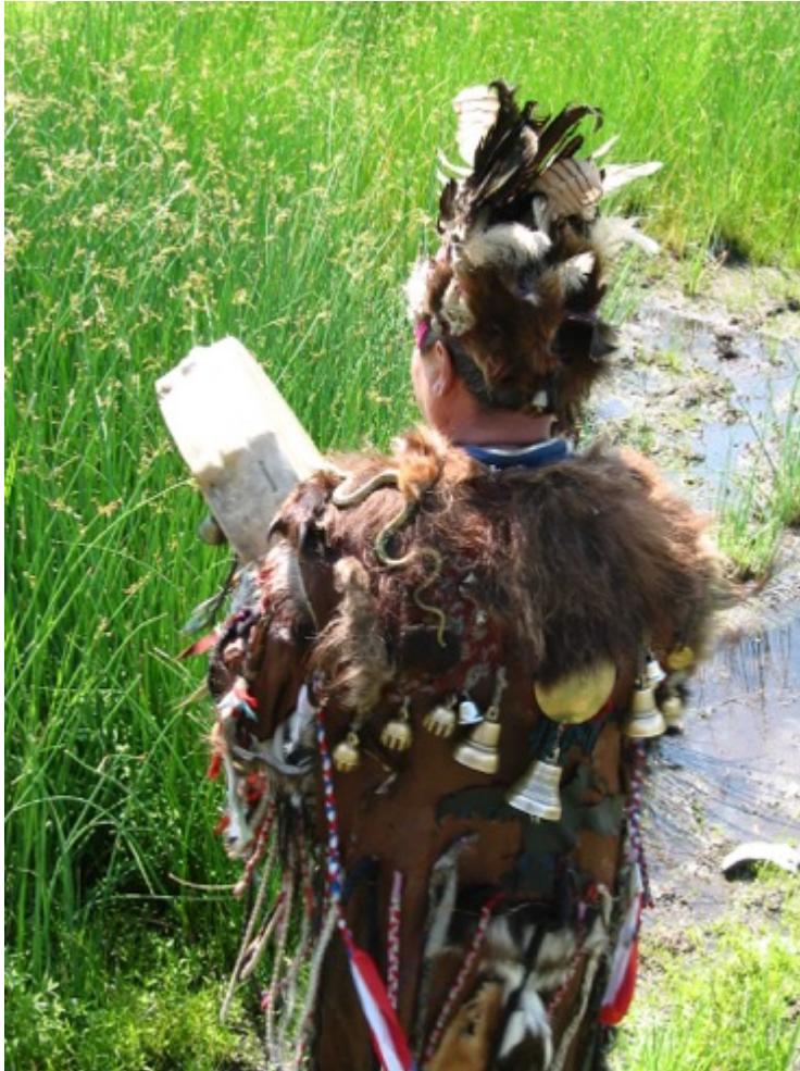
Fig. 2. « Serpents » en tissu et en plastique, clochettes, miroir protecteur sur le costume d'un chamane. Touva, Ulug-Khem, 2003.