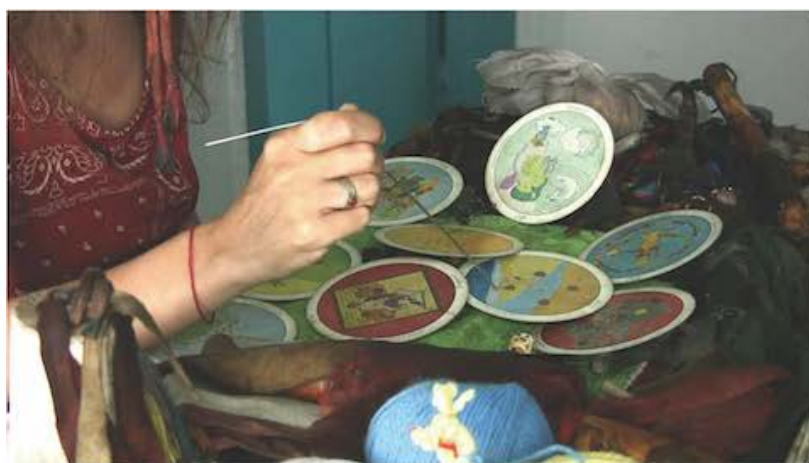
Fig. 5. Une séance de divination avec les cartes Tarot rondes. Touva, Shagaan-Aryg, 2009.

Enfin, le chamane reprend la pierre rouge de la main du patient, range les deux pierres et son miroir et fait une purification du patient avec de la fumée de genévrier.