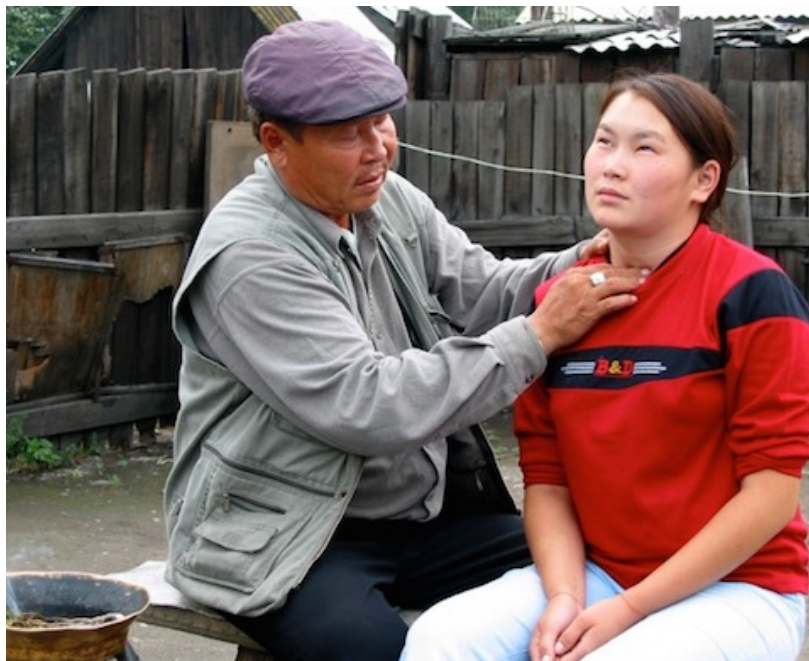
Fig. 1. Le massage chamanique. Touva, Kyzyl, 2003.

C'est dans la première moitié des années 1990 que le chamanisme touva est particulièrement exposé aux techniques rituelles et aux concepts qui lui sont au départ étrangers. Dès 1989, à Kyzyl apparaissent des réseaux de spécialistes rituels (qui se définissent comme bouddhistes, guérisseurs, plus rarement chamanes) qui s'intéressent à la littérature New Age russophone et aux diverses « écoles de guérison », venues de la partie européenne de la Russie. C'est ainsi que les individus qui se définiront comme chamanes quelques années plus tard apprennent l'existence des thérapies basées sur la notion d'énergie ou inspirées par l'hypnose. Parmi nos interviewés, nombreux avouent avoir été « guérisseurs extrasensoriels » (russe : extrasensy ) avant de devenir chamanes, et avoir pratiqué des techniques rituelles spécifiques, inconnues dans le chamanisme du passé. Certaines de ces techniques restent aujourd'hui présentes dans les rituels thérapeutiques de chamanes, notamment les massages avec ou sans contact avec le corps du patient.