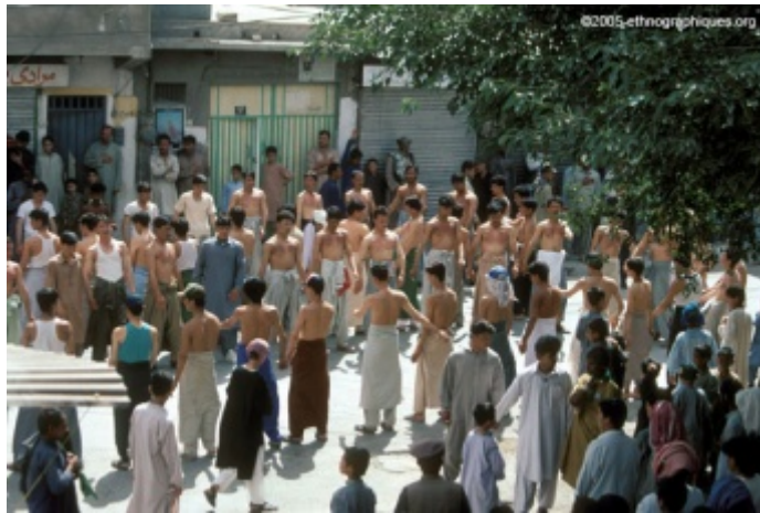
Illustration 6 Le cortège des pénitents. (Monsutti, 1996)