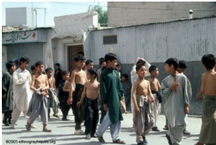
Illustration 7 Des enfants suivent et imitent les pénitents. (Monsutti, 1996)

En fin d'après-midi, des processions se forment à nouveau à partir des différents imâmbargâh de quartier. Sur un côté de la grande rue, une cordelette protège un espace réservé à la circulation des femmes. Sur la route elle-même, les cortèges de pénitents se succèdent, composés essentiellement de jeunes voire de très jeunes hommes. Des stands distribuent de l'eau, des douceurs, du pain et des concombres. Cela donne presque une ambiance carnavalesque, malgré les pleurs et le bruit sourd des coups. Les processions avancent lentement et s'arrêtent souvent. Le porteur du drapeau est précédé par une corde portée par quelques membres du service de sécurité de l' imâmbargâh , puis vient une camionnette sur le toit de laquelle plusieurs individus sont installés ; ils chantent dans un haut-parleur qui amplifie leur voix [Illustration 4]. Derrière eux, un certain nombre de fidèles, torsos nus — alors que la nudité est d'habitude proscrite —, avancent en quatre rangées lâches [Illustration 5]. Lorsque les chants se taisent, ceux placés à l'extérieur se tournent vers l'intérieur, et ceux placés à l'intérieur se tournent vers l'extérieur de façon à se faire face, et ils commencent à se frapper la poitrine en cadence [Illustration 6]. C'est une démonstration de courage