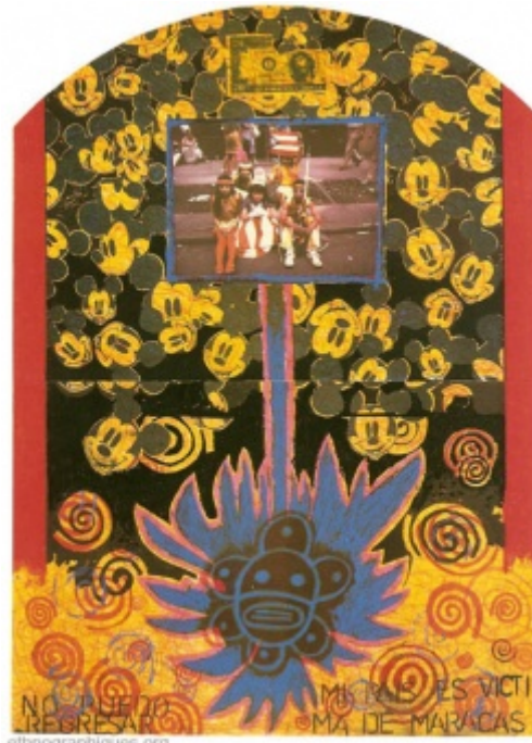
Confused Paradi(c)e , Technique mixte de Juan Sánchez, 1996, 104cm x 76cm

Juan estime avoir été très conscient du type de rapport qu'il entretenait avec ses origines. C'est d'ailleurs l'une des raisons pour lesquelles il voulut vivre un jour à Puerto Rico. Au début des années 1980, il avait déjà entrepris un premier voyage dans l'île pour reprendre contact avec la famille de sa mère. S'il en garde un « souvenir magnifique », Juan fait surtout remarquer que cette expérience avait réactivé en lui un complexe d'infériorité identitaire, car son espagnol n'était pas très bon, ce qui l'avait mis dans l'embarras. En outre, il n'avait pas échappé aux étiquettes que les insulaires lui accolaient : « je passais pour le Nuyorican ; on riait souvent de moi. Ce terme était dénigrant, alors qu'il m'apparaissait comme positif à New York ». Juan se défendait contre ces tentatives de dénigrement en rappelant que l'espagnol aussi était une langue de colonisés et qu'il fallait sortir d'une conception étroite de la nation portoricaine, car le sentiment d'appartenance identitaire n'a — dit-il — rien à voir avec le territoire ou la langue contrairement à ce que soutiennent bon nombre d'intellectuels portoricains.