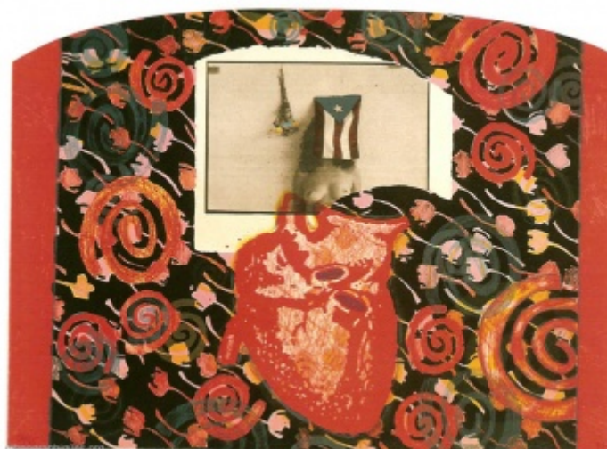
Puerto Rican Prisoner of War , Technique mixte de Juan Sánchez, 1994, 54cm x 74cm

Au début de ses vingt ans, Juan était proche des partis politiques portoricains radicaux qui ne refusaient pas la lutte armée. Un tel engagement en faveur de la nation portoricaine lui permettait de nourrir la réflexion qu'il entretenait sur ses problèmes d'appartenance et d'identité. Juan affirme avoir en effet ressenti la nécessité d'approfondir son lien avec ses origines : « je prenais de plus en plus conscience que je n'étais pas complet. En d'autres termes, je savais que j'étais portoricain, mais je ne savais pas ce que cela pouvait bien être [...]. Je commençais à réaliser qu'il y avait toute une série de questions auxquelles je ne pouvais pas répondre, que je vivais dans une certaine ambiguïté identitaire que je n'arrivais pas à saisir, à articuler. Pour commencer, je ne savais même pas pourquoi mes parents étaient venus dans ce pays. J'avais aussi du ressentiment à leur égard, car je ne comprenais pas pourquoi ils étaient venus à New York car c'était, parfois, terriblement difficile. J'ai alors cherché à mieux m'informer, à trouver des réponses à ces questions. Je les ai obtenues dans ces formes d'activisme ».