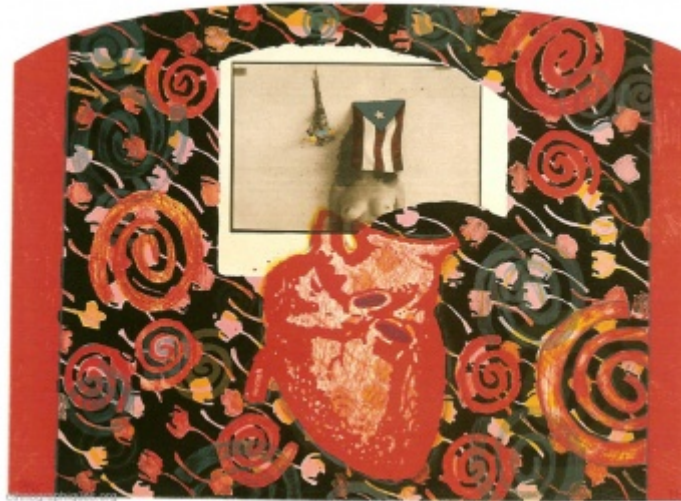
Puerto Rican Prisoner of War , Technique mixte de Juan Sánchez, 1994, 54cm x 74cm

Au début de ses vingt ans, Juan était proche des partis politiques portoricains radicaux qui ne refusaient pas la lutte armée. Un tel engagement en faveur de la nation portoricaine lui permettait de nourrir la réflexion qu'il entretenait sur ses problèmes d'appartenance et d'identité. Juan affirme avoir en effet ressenti la nécessité d'approfondir son lien avec ses origines : « je prenais de plus en plus conscience que je n'étais pas complet. En d'autres termes, je savais que j'étais portoricain, mais je ne savais pas ce que cela pouvait bien être [...]. Je commençais à réaliser qu'il y avait toute une série de questions auxquelles je ne pouvais pas répondre, que je vivais dans une certaine ambiguïté identitaire que je n'arrivais pas à saisir, à articuler. Pour commencer, je ne savais même pas pourquoi mes parents étaient venus dans ce pays. J'avais aussi du ressentiment à leur égard, car je ne comprenais pas pourquoi ils étaient venus à New York car c'était, parfois, terriblement difficile. J'ai alors cherché à mieux m'informer, à trouver des réponses à ces questions. Je les ai obtenues dans ces formes d'activisme ».