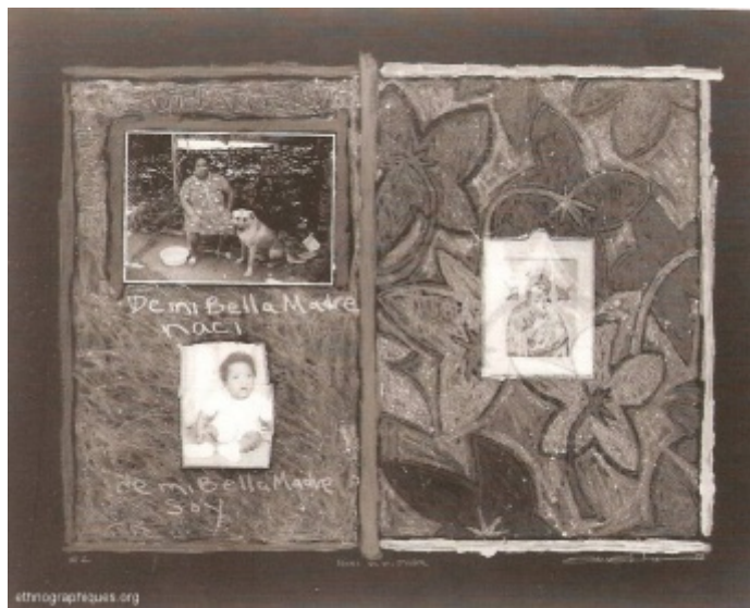
Naci de mi Madre , Monotype avec collage de Juan Sánchez, 1990, 73cm x 109cm.

Juan est né, a grandi et a vécu toute sa vie à Brooklyn. Agé de 50 ans, il a toujours habité des communautés à large dominance hispanophone — Brownsville, Bedford-Stuyvesant, Bushwick — généralement formées de migrants portoricains de première génération venus s'installer à New York durant les années 1950 et 1960. Juan se rappelle avoir constamment baigné dans un environnement protégé, proche du mode de vie insulaire : « c'était très facile pour ces migrants de préserver leur identité culturelle ; ils s'accrochaient véritablement à leur communauté, ne perdaient jamais de vue leurs traditions, c'était une pratique quotidienne. En surface du moins, il s'agissait d'une zone de confort : les barbiers, les salons-lavoirs, les journaux, les boulangeries, les épiceries, les botanicas [6], les magasins de fleurs étaient tenus par des Portoricains qui les nommaient d'après leur ville d'origine, suspendaient des drapeaux partout et placardaient des affiches de Puerto Rico dans tous les coins ».