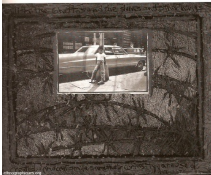
With the Ghettos... , Monotype avec collage de Juan Sánchez, 1990, 73cm x 109cm

La question de la langue était particulièrement révélatrice à cet égard. En effet, Juan perdait progressivement l'usage de l'espagnol pendant son adolescence, même si sa mère lui répondait toujours dans cette langue. Avec ses frères, il commençait à parler uniquement en anglais avant de réapprendre l'espagnol, bien des années plus tard ; actuellement, il dit changer fréquemment de code linguistique avec eux. Mais au-delà du changement de code, c'était bien — durant la scolarité obligatoire du moins — l'apprentissage d'une forme syncrétique entre l'anglais et l'espagnol, le spanglish [9], qui signalait son immersion dans une sous-culture émergente, propre aux descendants de migrants portoricains : celle des Nuyoricans .