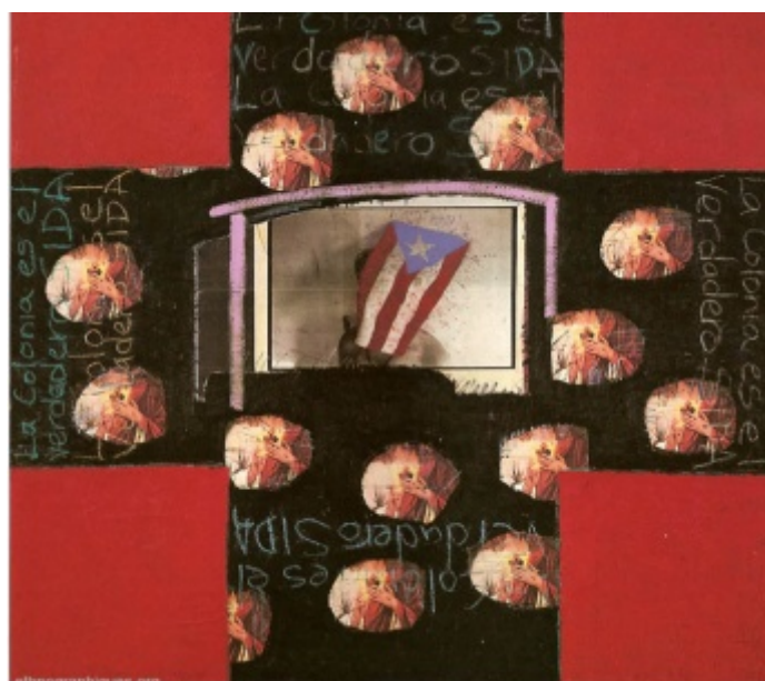
La colonia es el verdadero sida , Technique mixte de Juan Sánchez, 1992, 178cm x 198cm

Pour mon interlocuteur, le lieu géographique importe finalement peu dans la construction d'une identité portoricaine : « notre conscience d'être portoricain n'a rien à faire avec le territoire. Si nous regardons les membres de la diaspora africaine, s'ils sont nés à Cuba, en Caroline ou en Afrique, c'est toujours un Noir qui dérive de ce dernier continent ; si les cloches sonnent le rassemblement, s'il y a un appel pour tous les Juifs par exemple, peu importe où ils sont nés ou quelle langue ils parlent : ils se rassemblent tous et font front commun ». Juan pense ainsi que le problème des Portoricains de la diaspora tient au fait que ces derniers sont amputés d'une partie de leur identité. Il argumente sa position en prenant exemple sur sa fille de quatorze ans, actuellement confrontée à des difficultés scolaires en anglais. Ses instituteurs, des Afro-américains, ont suggéré à Juan qu'elle abandonne l'apprentissage de l'espagnol, ce qui a considérablement fâché mon interlocuteur : ce dernier me signale en effet que les instituteurs blancs avaient tenu le même discours à son propre mère une trentaine d'années plus tôt à son sujet.