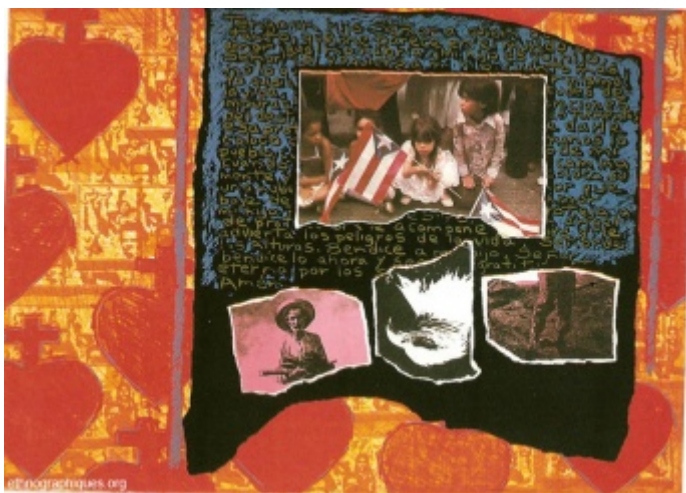
Prayer and Struggle, Lithographie de Juan Sánchez, 1990, 55cm x 76cm

A la suite de sa scolarisation, Juan s'assimilait progressivement au mode de vie de l'un des quartiers les « plus durs de Brooklyn », faisant bientôt de l'anglais sa langue principale. Il s'éloignait de plus en plus de sa première zone de confort portoricaine. En classe par exemple, il percevait une grande différence culturelle avec les jeunes Portoricains qui débarquaient à New York et ne partageaient pas encore la même réalité sociale que lui. Ces nouveaux migrants restaient à ses yeux une curiosité, non sans provoquer parfois chez lui un sentiment de rejet. Juan fait remarquer à ce propos que les différences s'établissaient moins sur une base ethnique ou nationale que raciale. En tant que Noir — et bien que les Afro-américains eussent toujours noté ce qui les séparait de lui — il dit ne pas être arrivé à s'identifier à ces enfants insulaires qui ne parlaient pas l'anglais, mais un espagnol perçu comme « parfait ». Ces derniers étaient toujours mis à distance : « même si quelques-uns venaient d'une agglomération urbaine comme San Juan, ils restaient des hillbillies [7] qui portaient des pantalons toujours trop courts et des chaussettes blanches ». Avec du recul, Juan estime que « ceux de l'île incarnaient quelque chose que nous n'étions pas [...]. A un niveau inconscient, ils représentaient une entité qui était complète, car nous avons beaucoup de vides en termes d'identité ».