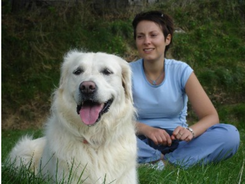
Moksha et l'auteure (Vicart, 2006)

attention à Moksha. Cependant, je sais qu'elle n'est pas loin et je prends en compte sa présence dans mes déplacements, en faisant machinalement attention de ne pas lui marcher dessus. Après quelques secondes à fixer mes mouvements, elle fixe des yeux le sol, les oreilles un peu levées, la truffe concentrée sur quelques miettes qu'elle se met à lécher.