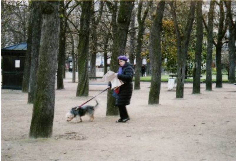
Exploration du monde (Herlant, 2008)