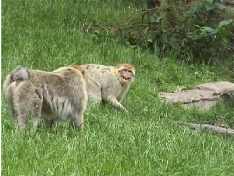
« Négociation comportementale » lors d'un moment tendu (Vicart, 2007)

Par ailleurs, c'est peut être ici que nous pourrions situer la limite entre lien social et attachement. En effet, la construction de ce lien social entre la femelle macaque et nous, ne tient scrupuleusement que par notre travail respectif d'acteurs vigilants et suppose que chacun de nous compose pour lui-même la totalité dans laquelle il se situe (Latour, 1994). C'est pourquoi ce lien social tissé avec l'animal non familier demeure fragile, non sécurisé, donc relativement angoissant, car dépourvu de moyens formels ou informels pour garantir la confiance : il reste inscrit dans la simultanéité de l'espace et le temps des corps en coprésence, mis à nu, entiers, non disloqués. Il ne possède donc aucune partition, aucun « opérateur de réduction » (Latour, 1994) issu de situations précédentes, qui permettrait aux partenaires de s'y référer « ensemble » en cas de litige, et par la même occasion de se détendre, de se relâcher et de déborder. Etre avec la présence étrangère d'un singe au cœur d'une situation non équipée, ne permet pas de parler d'attachement au sens où nous voulons l'entendre : être avec ne veut pas forcément dire être ensemble .