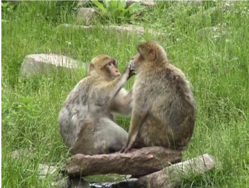
Jeux de proximité : séance d'épouillage (Vicart, 2007)