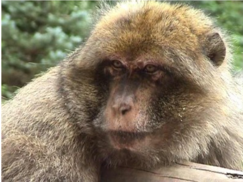
Individu macaque japonais, réserve de Kintzheim (Vicart, 2007)

un peu. J'ai appris dans les livres d'éthologie que cette « grimace » connote la menace. Je suis très tendue. Je me surprends même à contrôler les mouvements de ma respiration de peur, pensai-je à cet instant, qu'ils soient trop brusques et interprétés par la femelle comme des tentatives d'attaque de ma part. En fait, j'ai vraiment peur, cette femelle macaque me semble imprévisible. Je rebaisse la tête et les yeux pour ne pas la fixer et je réfléchis déjà de quel côté m'échapper le plus rapidement au cas où elle se jetterait sur moi.