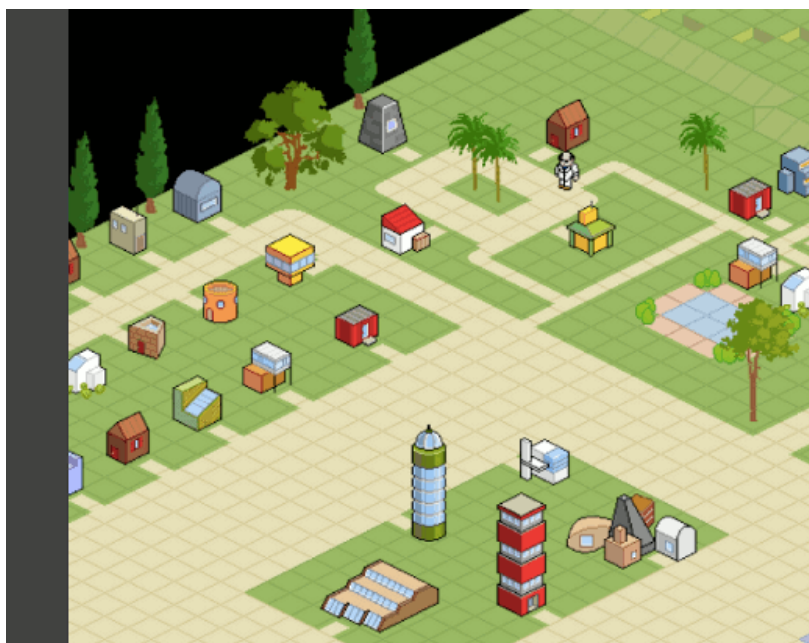
Avatar de l'auteur sur la plateforme Arianna devant sa "cabane" du quartier des chercheurs

Hormis l'apport pour le moment peu convaincant du numérique pour les actrices de ma recherche, les aspects bénéfiques du parcoursArianna sont pourtant loin d'être négligeables, comme je l'ai montré ailleurs (Amrein 2007a, 2007b). Parmi les aspects positifs de cette expérience dans le Val d'Anniviers, je relèverai pour conclure un phénomène quelque peu paradoxal qu'il s'agit de mettre en relation avec l'importance accordée dans la didactique de la formation aux échanges permanents entre participantes : l'apprentissage en commun des techniques de communication "à distance" semble avoir surtout eu pour effet de renforcer les liens de proximité entre des femmes qui en avaient parfois perdu l'habitude, d'avoir créé des amitiés entre celles qui ne se connaissaient pas auparavant et, à défaut d'avoir multiplié les rencontres virtuelles, d'avoir encouragé les relations "en présence" entre des habitantes de la vallée qui ont partagé durant deux ans l'aventure du parcoursArianna .