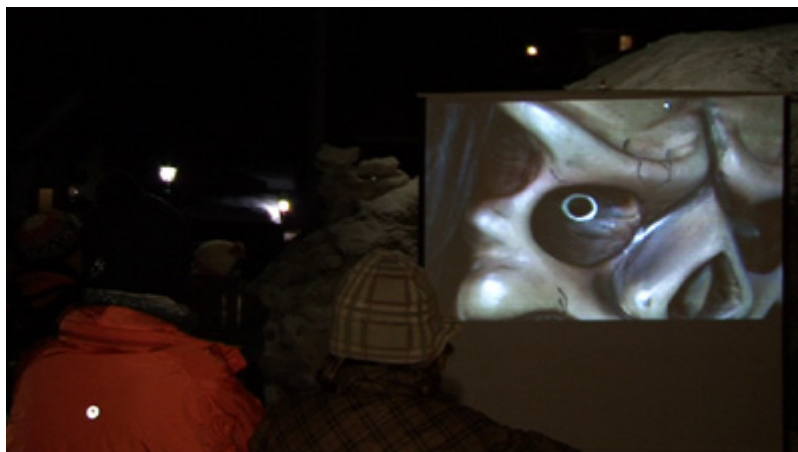
Présentation du film sur les Tschäggättä réalisé par Bernhard Rieder Sur le parcours du cortège de nuit. Wiler, février 2007.

La présence quasi continue de chercheurs au Lötschental depuis le XIX e siècle et l'intérêt pour les masques a également suscité des réactions parmi les habitants de la vallée : ils se sont adaptés à la demande extérieure en produisant des pièces pour les ethnologues puis pour les touristes. L'apport économique a été certain, puisque quelques familles ont pu vivre de la vente des masques [20] et que l'industrie touristique a bénéficié et bénéficie encore de la publicité faite par les Tschäggättä. Pour autant, comme en témoignent les querelles esthétiques signalées ci-dessus, cette pratique carnavalesque ne s'est pas figée. Ni les ethnologues et leurs théories, ni les touristes et la crainte de leurs plaintes, n'ont eu raison d'elle ni réussi à la momifier. Si le type « masque du Lötschental » représente une contrainte, c'est au travers des modalités conflictuelles du jeu mené avec elle que cette pratique se transmet comme « tradition » tout en se remodelant selon la conjoncture et connaissant périodiquement des hauts et des bas en fonction de l'intérêt que les différentes générations lui portent. C'est ainsi qu'une période un peu creuse dans les années quatre-vingt a été suivie d'un renouvellement et d'une adaptation du carnaval marquée par un retour puis une prolifération des masques à porter individuels.