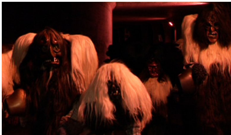
Cortège de nuit de Blatten à Wiler (séquence vidéo)

Depuis quelques années cependant, comme en réponse à la récupération par l'office du tourisme de la contestation du Jeudi gras, un mouvement de contestation analogue se dessine au sein même du cortège du samedi après-midi, portant sur l'esthétique des figures masquées et sur leur comportement : certaines Tschäggättä y affichent leur refus de se conformer au « modèle » prisé par le jury en renouant avec celle que leurs prédécesseurs en rébellion adoptèrent lorsqu'ils défièrent le Conseil