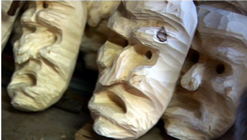
Masques souvenirs et masques à porter (séquence vidéo)