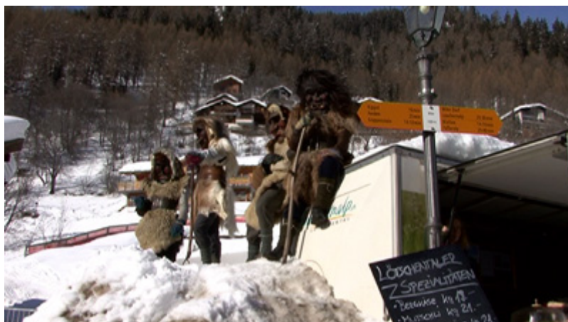
Cortège du samedi. Wiler, février 2009.

Les divergences sur l'esthétique des Tschägättä et les nombreux récits produits à leur sujet témoignent de la créativité des sculpteurs et de la vitalité de la pratique, mais elles laissent entrevoir aussi des rivalités opposant, pour le prestige, des familles qui aspirent chacune à s'attribuer le monopole des discours sur les masques. Ces rivalités traduisent à leur tour les mutations économiques accélérées que connaissent les familles du Lötschental avec l'intensification de leur intégration au marché touristique à partir de la seconde moitié du XX e siècle [25]. Bousculant les anciennes hiérarchies fondées sur l'accès inégal à la propriété des terres et des bêtes, ces mutations en instaurent de nouvelles fondées sur l'accès, tout aussi inégal, aux formations et aux activités requises par un tel marché, devenu aujourd'hui planétaire.