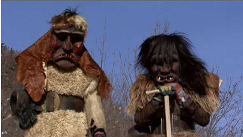
En guise de conclusion