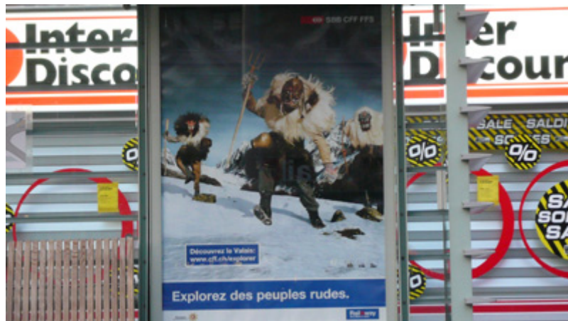
Gare de Lausanne. Janvier 2007.

« Plus cliché, tu meurs. Des monstres aux masques de bois, une fourche dans la main, dévalent une pente enneigée. Tout juste si on ne les entend pas hurler » écrit la journaliste Ariane Dayer dans Le Matin dimanche , daté du 21 janvier 2007. Dans un article intitulé « Le grand retour du crétin des Alpes », elle décrypte avec humeur une campagne publicitaire des chemins de fer fédéraux mettant en scène trois figures masquées, protagonistes d'un des carnivals les plus célèbres de Suisse, le carnaval des Tschägäggättä [1] dans le Lötschental . Si la photographie lui paraît déjà lourde de sens, elle s'indigne surtout du slogan choisi par l'agence de publicité « Explorez les peuples rudes », rappelant selon elle la réputation déplorable de crétinisme qui a longtemps poursuivi les habitants du canton du Valais. L'affiche fait partie d'une campagne de publicité qui