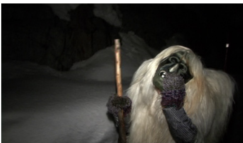
Blatten, février 2008.

Les récits recueillis et les observations réalisées nous laissent entrevoir, sur le plan de l'esthétique de la figure dans son ensemble, des divergences analogues à celles relevées pour le masque proprement dit. Afin d'en mesurer l'enjeu, il nous faut avoir à l'esprit quelques-unes des conséquences que leur emblématisation exerce sur l'allure et le comportement des Tschägättä.