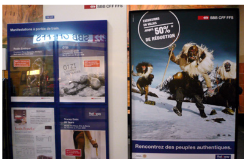
Rencontrez des peuples authentiques (séquence vidéo)

relation avec un hors-champ global, moderne et ouvert auquel s'adresse l'injonction « Explorez ». Prenant l'invitation à la lettre, cet article vous propose une rencontre avec ces peuples « rudes » et « authentiques ». En parcourant à la fois ce champ et ce hors-champ, il ne s'agit pas tant de déceler les intentions de la régie de transport ou la stratégie de l'agence publicitaire, que de s'intéresser à la configuration qui se déploie en arrière-fond : derrière les masques, il y a des acteurs mais aussi des théories et des conflits esthétiques, des luttes d'influence entre des familles, la constitution d'un type de masques et un jeu carnavalesque avec les catégories sociales. Et l'image des hommes sauvages et menaçants dans un paysage enneigé cache autant qu'elle révèle le récit complexe de l'histoire récente de la vallée dans lequel les sculpteurs, les touristes, les publicitaires, les ethnologues et les muséographes tiennent chacun leur place.