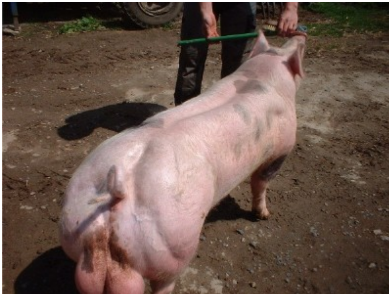
Un reproducteur Piétrain standard.

Préparer un concours, c'est avant tout choisir les animaux qui peuvent revendiquer une place de participants. Quels candidats sont les plus susceptibles de mettre en valeur l'élevage familial ? Quels sont ceux qui, aux yeux de chaque sélectionneur, peuvent représenter au mieux les standards de la race ? « Le cochon idéal ? Ca devient difficile à expliquer... Un qui a un peu tous les facteurs (du modèle idéal)... et qu'on se dit : un comme ça, on n'en sort pas souvent. On l'a, il est supérieur à la moyenne, et voilà... c'est Lui. Mais quand tout le monde rassemble son Lui, ça fait déjà des différences... Chaque éleveur a un des facteurs idéaux qu'il va toujours mettre en avant dans son élevage... ». Dans la sélection, la question du « bon » modèle est omniprésente (Quinn, 1993 ; Lizet, 1996 ; Bougler et Delage, 1999). Et dans le cas précis du Piétrain, on attachera de l'importance à la musculature de l'animal : des épaules et un dos large, et des jambons très développés : « Le verrat Piétrain sert à ramener de la viande sur une truie industrielle de mauvaise qualité... ».