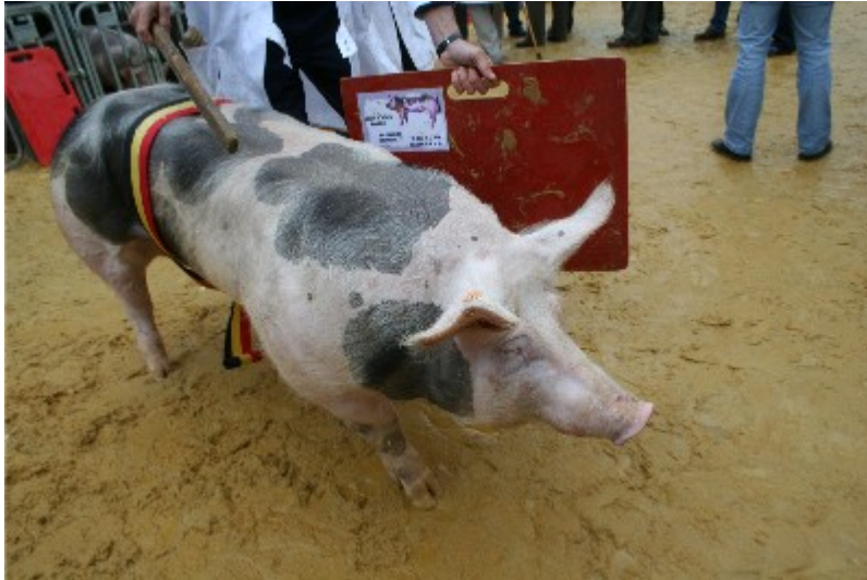
Muni d'une planche et d'un bâton, le sélectionneur présente son verrat dans le ring.