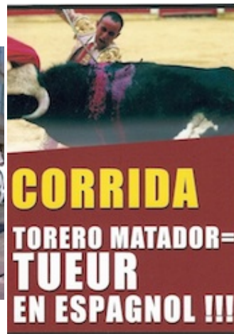
Photo 4 : Inconnu, tract de la Fondation Brigitte Bardot Relevé à Nîmes, le 13/09/08

Cependant, les réactions affectives de répugnance sollicitées par de tels dispositifs peuvent à tout moment se retourner en sentiment d'inconvenance et d'antipathie à l'encontre même de ceux qui affirment les provoquer pour la « bonne cause ». En incommodant ceux qui n'apprécient guère que leur sensibilité soit mise à l'épreuve d'une manière jugée aussi agressive qu'inopinée, les opposants à la corrida risquent de transformer des soutiens potentiels en détracteurs avérés. C'est pourquoi les entrepreneurs de protestation morale doivent souvent recourir à des dispositifs permettant de retranscrire leur indignation sous des formes socialement moins controversées. De multiples équipements et conduites visent ainsi à faire apparaître la manifestation sous un jour pittoresque, créatif, sympathique et, qui plus est, immédiatement adapté aux formats « sexy et punchy » valorisés par les professionnels des médias (Lemieux, 2000). A Fréjus, en 2005, par exemple, une manifestante drapée dans une longue cape vermeille déambule avec une épée de toréador fichée en travers de la tête (photo 5). A Nîmes, en 2008, c'est ce manifestant masqué et enchaîné qui déploie un drap « non à la