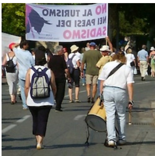
Photo 7 : Fréjus, 16/07/05 Fréjus, 16/07/05

Plus que tout autre dispositif, les arrangements musicaux sont les mieux à même de moduler les impressions recherchées auprès des spectateurs (Traini, 2008). A Nîmes, en 2008, c'est un groupe de bénévoles qui rythme la marche avec leurs tambours afin de galvaniser les troupes. Ce dispositif musical apparaît d'autant plus efficace que, suite à la manifestation de Fréjus, des militants avaient regretté qu'un unique tambour ait imposé un rythme grave et lancinant évoquant une marche aussi funèbre que discrète : « la manifestation était silencieuse (juste des battements de tambour) et donc a dû passer inaperçue de pas mal de fréjussiens » http://www.animauzine.net/article.php3?id_article=791 (photo 7).