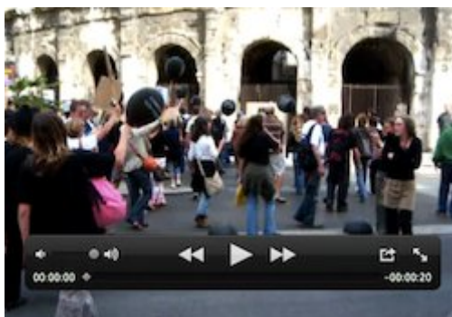
( extrait vidéo 2 )