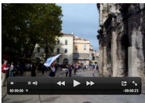
( extrait vidéo 7 )

Loin d'exclusivement se réduire à un jeu théâtral, à des conduites tactiques visant à peser sur la définition des situations, les émotions bruyamment exprimées par les manifestants trahissent des traces d'expériences affectives sans lesquelles on pourrait difficilement comprendre qu'ils fassent preuve d'une telle motivation dans la