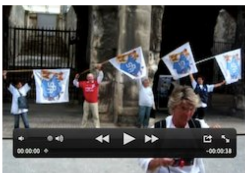
( extrait vidéo 6 )

Il devient dès lors difficile de ne pas remarquer certains détails ayant trait aux attitudes manifestées par certains lors du charivari devant les arènes de Nîmes. S'il n'est pas impossible que certains sur-jouent leur indignation, on peut également faire l'hypothèse que, pour d'autres, les émotions exprimées prolongent des sentiments qui résultent de situations biographiques passées au cours desquelles ils se trouvèrent assignés à un rôle qu'ils apparentent à celui du taureau. Sans cette identification des femmes et des hommes à la victime animale, on ne pourrait s'expliquer l'intensité des émotions manifestées par certains. Ici, c'est cette femme qui, face aux arènes, et en dépit des consignes des organisateurs de la manifestation, vocifère « Assassins ! Assassins ! » avec une virulence qu'il semblerait hâtif d'attribuer à une mise en scène stratégique. Là, c'est ce monsieur âgé, qui — cette fois-ci dans le champ de vision de notre caméra — va-et-vient avec un sifflet, et souffle à en perdre haleine [18] (extraits vidéos 6 et 7).