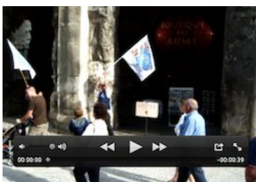
( extrait vidéo 3 )

Le visionnage ultérieur de ces films me confirmera qu'ils constituent des données essentielles pour se demander pourquoi et comment des émotions se manifestent au cours même de l'action manifestante. Je m'efforcerai de montrer ici qu'un questionnement de ce type requiert cependant la plus grande attention sur l' a priori théorique et méthodologique adopté par le chercheur. Par là, il s'agira également de préciser en quoi consiste exactement l' observation propre aux sciences sociales que cela soit in situ ou à travers la vision ultérieure de films ou de photographies. L'essentiel du propos consistera à montrer à quel point l'analyse de ce qui se joue pendant la manifestation ne peut exclusivement porter sur ce qui est relevé au cœur même de l'évènement. Faits notés sur un cahier, détails apparaissant sur une vidéo, photographies qui par leur cadrage permettent de mieux distinguer un trait déterminé [4] : de telles données ne deviennent significatives qu'à partir du moment où le chercheur s'applique à les intégrer à un faisceau d'indices recueillis par bien d'autres voies d'enquête que la seule présence au sein de tel ou tel rassemblement.