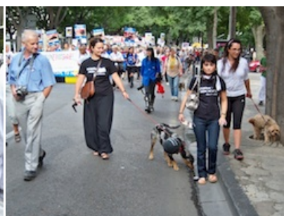
Photo 16 : Nîmes, 13/09/08 Nîmes, 13/09/08

Ces simples images se doivent d'être recoupées avec une analyse des associations qui, à la veille de la manifestation, ont déclaré leur intention de s'y rendre. Une liste diffusée par la newsletter « Animauzine pour les militant-e-s de la cause des animaux » permet de repérer l'importance de la mobilisation au sein de ceux qui se préoccupent d'apporter des soins à l'animal d'affection par excellence : le chien. Ainsi, le dénombrement des associations ayant pour objet principal le recueil, les soins et l'adoption de chiens abandonnés (auquel nous avons ajouté la SPA et la Fondation Brigitte Bardot qui, bien que généralistes, gèrent des refuges) permet de comptabiliser 17 unités, qui équivalent à 36% de l'effectif total [12].