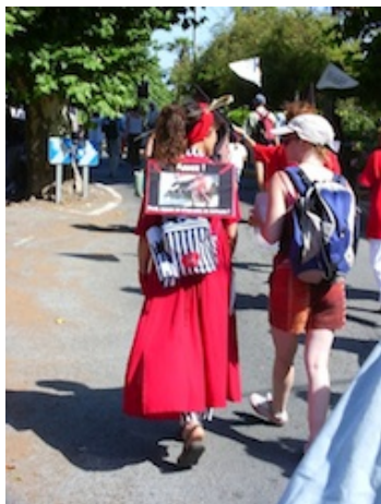
Photo 5 : Fréjus, 16/07/05 Fréjus, 16/07/05

torture » (photo 6) : celui-ci ne cesse d'écarter les bras et de prendre la pose dès qu'un journaliste ou un manifestant tend un appareil photographique ou une caméra.