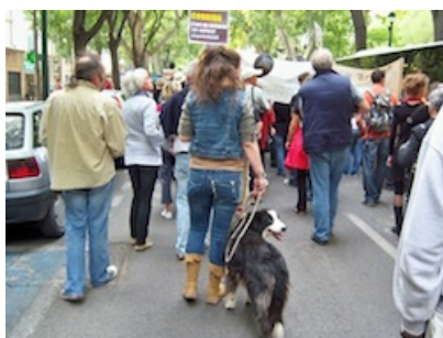
Photo 15 : Nîmes, 13/09/08 Nîmes, 13/09/08

En visionnant à nouveau la vidéo 1 ou en ayant recours à des photographies opportunément cadrées, il est possible de remarquer un grand nombre de chiens tenus en laisse par des manifestants (photo 15, photo 16).