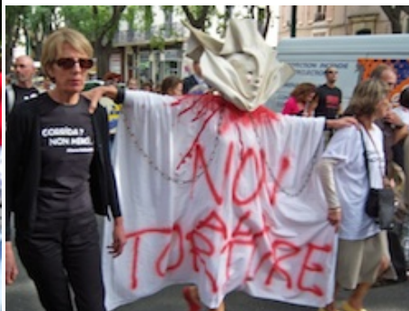
Photo 6 : Nîmes, 13/09/08 Nîmes, 13/09/08

Plus que tout autre dispositif, les arrangements musicaux sont les mieux à même de moduler les impressions recherchées auprès des spectateurs (Traini, 2008). A Nîmes, en 2008, c'est un groupe de bénévoles qui rythme la marche avec leurs tambours afin de galvaniser les troupes. Ce dispositif musical apparaît d'autant plus efficace que, suite à la manifestation de Fréjus, des militants avaient regretté qu'un unique tambour ait imposé un rythme grave et lancinant évoquant une marche aussi funèbre que discrète : « la manifestation était silencieuse (juste des battements de tambour) et donc a dû passer inaperçue de pas mal de fréjussiens » http://www.animauzine.net/article.php3?id_article=791 (photo 7).