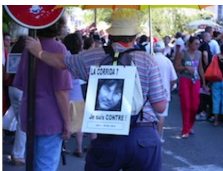
Photo 1 : Fréjus, 16/07/05 Fréjus, 16/07/05

Cet effort de mise en scène du nombre, indispensable pour éviter que la revendication exprimée soit considérée comme trop singulière pour être légitime, n'est jamais aussi visible qu'à travers les techniques utilisées pour pallier sa mise en défaut. Ainsi, lors des manifestations de 2004 et 2005, à Nîmes et à Fréjus, les organisateurs s'appliquent à déjouer le risque d'être jugés peu nombreux en équipant les militants présents de panneaux à l'effigie de personnalités connues pour leur opposition à la corrida (photos 1 et 2). Nicola Hulot, Renaud, Michel Drucker, Rika Zaraï, et bien d'autres encore, purent ainsi défiler, pour ainsi dire par procuration, afin d'attester de la notabilité dont peuvent se prévaloir les opposants à la tauromachie.