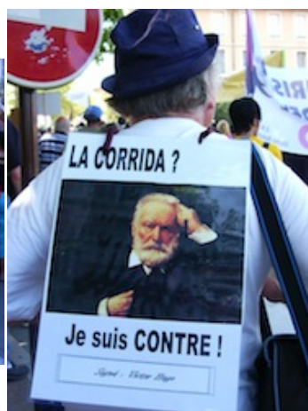
Photo 2 : Fréjus, 16/07/05 Fréjus, 16/07/05

Cette manière d'enrôler des personnalités connues permet non seulement de grandir la cause, mais encore d'éviter aux manifestants anonymes d'apparaître comme une poignée d'excentriques aux récriminations insolites. Lorsqu'il s'appuie sur des personnages tels Victor Hugo, le procédé alimente également ce travail de filiation à travers lequel les militants s'efforcent de présenter leur engagement comme le prolongement des combats entamés par d'illustres prédécesseurs. Le caractère apprêté de cette mise en scène de la respectabilité des opposants est d'autant plus évident que les organisateurs prennent soin de diffuser, à l'attention des participants, des « consignes techniques » leur recommandant de soigner la dignité de leurs postures et de leurs slogans : « Afin de voir notre marche se dérouler sans incidents préjudiciables à l'image des anticorrida, chacun devra veiller à ce que les consignes distribuées sur place en trois langues soient impérativement