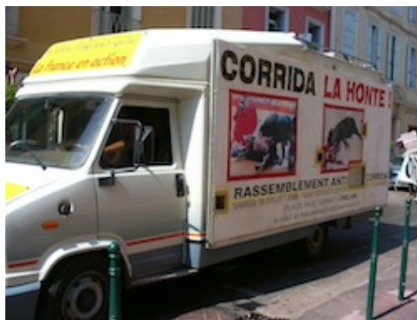
Photo 3 : Fréjus, 16/07/05 Fréjus, 16/07/05

Afin de solliciter des réactions affectives susceptibles de conduire ceux qui les éprouvent à soutenir leur cause, les opposants à la tauromachie recourent à plusieurs types de dispositifs de sensibilisation (Traïni, 2009). Souvent, il s'agit de susciter l'aversion, le dégoût, l'effroi, en décrivant la corrida sous les traits d'une pratique violente, sanguinolente et macabre. De nombreuses affiches et tracts circulant au cours des manifestations présentent ainsi des images au contenu volontairement choquant. C'est le cas, par exemple, de ces images sanglantes de taureaux ou de chevaux éventrés placardées sur un camion qui suivra les manifestants rassemblés à Fréjus en 2005 (photo 3). C'est encore le cas du verso de ce tract de la Fondation Brigitte Bardot, que chacun est invité à « transformer en pancarte en la collant sur un support cartonné », et sur laquelle un matador semble rugir telle une bête fauve (photo 4).