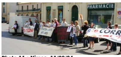
Photo 11 : Nîmes, 11/09/04 Nîmes, 11/09/04

La perspective dramaturgique, qui nous a permis jusqu'ici de rendre compte des indéniables dimensions stratégiques de l'action manifestante, ne peut que nous inciter à attribuer l'intensité du charivari devant les arènes nîmoises à une théâtralisation continûment orientée vers le public. On ne peut ignorer, en effet, la diversité et la récurrence des mises en scènes à travers lesquelles les opposants à la corrída s'emploient à proclamer publiquement l'indignation que leur inspire la pratique. Quatre ans auparavant, les militants s'étaient déjà alignés devant les arènes afin de constituer une « allée de la honte » qui, comparativement au charivari de 2008, demeura très discrète et timide, compte tenu du faible effectif présent (photo 11, photo 12).