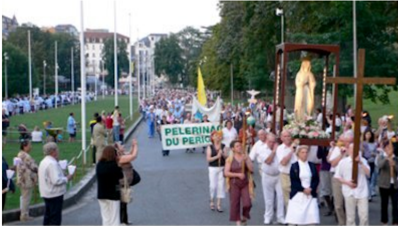
Lourdes, juillet 2007, procession aux flambeaux.

connu et rassurant : le culte marial. Voilà l'union réalisée des officiants et de leur troupeau ; voilà la foule éclairée ; sa force orientée dans des voies sûres ; ses croyances organisées en un ensemble de prescriptions et de pratiques rituelles. Le mouvement de cette transformation correspond à ce que Max Weber désigne comme un processus de « routinisation du charisme ». Le pèlerinage remplit une fonction dans une institution permanente : la foule « avide de merveilleux » (Touvet, 2007 : 95) se convertit en cortège de pèlerins en procession, exaltant les pouvoirs de la Vierge et sa bienveillance ; la grotte, élément de folklore pyrénéen, est "disciplinée" à l'aide de pavés et de grilles - la basilique en surplomb faisant peser sur elle tout son poids d'orthodoxie (Harris, 2001 : 237).