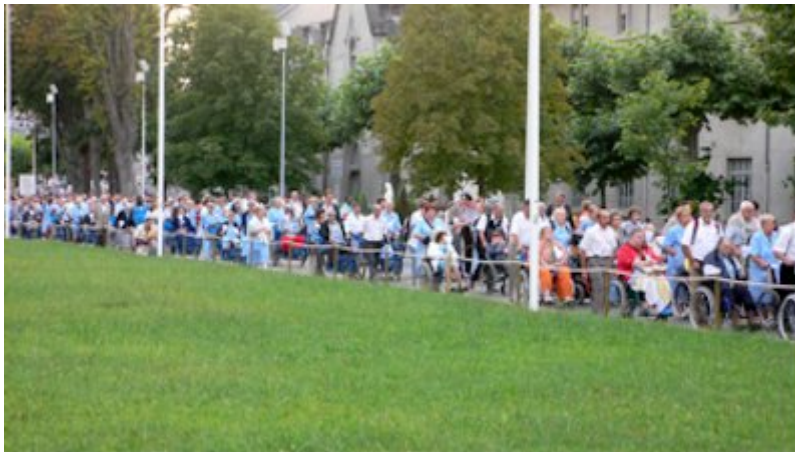
Lourdes, juillet 2007, procession aux flambeaux.