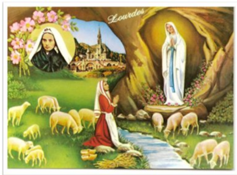
Carte postale représentant « l'Apparition ». Edition A. Doucet, Lourdes.