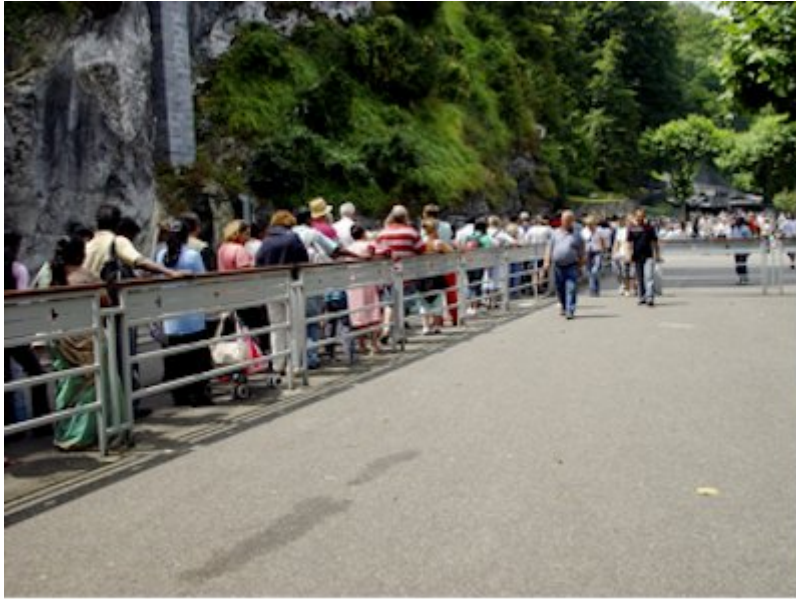
Lourdes, juillet 2007, file d'attente de la grotte.