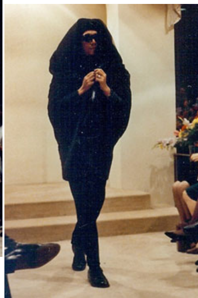
« Le défilé des folles » 2. Cliché Anne Monjaret.

Profitant de la fête patronale, les employés hommes d'une maison de couture décident en novembre 1989 d'organiser leur propre défilé dans les salons prestigieux de l'établissement. Devant un parterre de fans - leurs collègues -, ils caricaturent les mannequins qu'ils côtoient, prennent des poses évocatrices et montrent ainsi combien eux aussi sont de la partie, tout en adoptant un regard critique. Cliché Anne Monjaret.