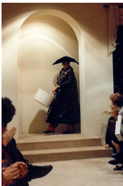
« Le défilé des folles » 1

Si les échanges peuvent être graves, ils se font également joviaux. Les mots pour sourire ou rire ne sont pas étrangers aux modes expressifs des mondes professionnels. Les relations à plaisanterie festives sortent des relations d'évitement quotidiennes. Ce jour-là, les barrières de la hiérarchie peuvent être levées, les personnels se permettent d'abandonner les codes habituels de la convenance, de jouer des symboles. En 1984, dans un atelier de couture célébrant la Sainte-Catherine à laquelle je participe, une jeune fille fait irruption déguisée a priori en paysanne : la poitrine et à l'arrière train généreux, mais très vite elle exhibe fièrement d'autres atours : le ventre arrondi des femmes enceintes et un sexe masculin prééminent qu'elle cache sous ses jupons. Cet accoutrement hybride affiche des états aux antipodes de ceux habituellement véhiculés par le milieu de la mode. Dans ce même établissement, en 1989, cette fois ce sont les hommes qui parodent devant leurs collègues.