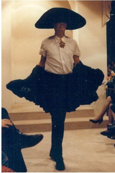
« Le défilé des folles » 3