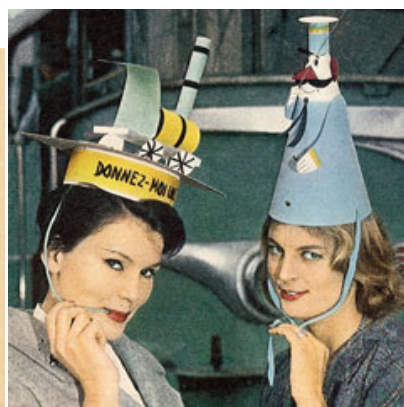
Dans son journal, La vie du Rail (5 novembre 1961), la SNCF donne également des idées de chapeaux et des conseils de fabrication aux collègues qui s'aviseraient d'en fabriquer. Les références à l'entreprise s'affichent sur le chapeau. Extrait de La vie du Rail 1961.