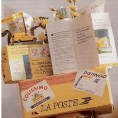
A La Poste, on n'oublie pas non plus de fêter les catherinettes. En 1988, un chapeau offert à une employée, par son chef de service qui a lui-même conçu l'objet, se renseignant autour de lui pour parfaire sa réalisation.