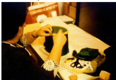
La fabrication d'un chapeau à l'heure de la pause déjeuner (1984) 3.