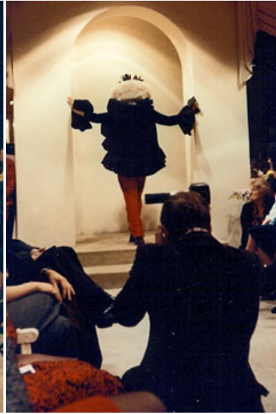
« Le défilé des folles » 4