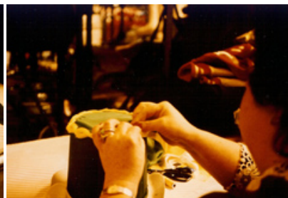
La fabrication d'un chapeau à l'heure de la pause déjeuner (1984) 2.