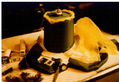
La fabrication d'un chapeau à l'heure de la pause déjeuner (1984) 1.

Mais plus généralement, les employés composent avec les contraintes horaires du travail. Ils utilisent les temps interstitiels qui ponctuent leur journée, par exemple la pause déjeuner pour s’y consacrer.