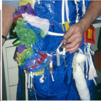
En octobre 2000, à l'occasion du départ à la retraite de l'un de leurs collègues, agent dans un hôpital, rattaché au service transport-entretien, une couturière lui a concocté un déguisement qui mélange signes privés et professionnels. Le bleu de travail, par excellence un vêtement professionnel est représenté par un tablier bleu orné de multiples objets dont une série de sacs plastiques évoquant son travail d'entretien, codé par des couleurs.