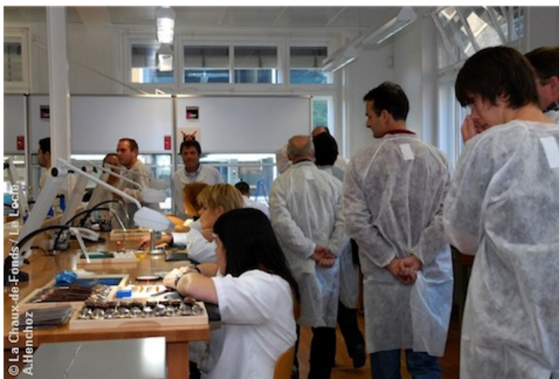
1ère Journée du patrimoine horloger, 2007.

lieux dévolus à la pratique de l'horlogerie tels que les usines, les ateliers d'horlogerie et de métiers ayant trait à celle-ci, les écoles professionnelles et les musées. En initiant de telles collaborations, les organisateurs des JPH faisaient le "pari" de « [...] donner l'occasion au grand public de se familiariser avec le riche patrimoine horloger matériel et immatériel de la région, et [de] valoriser [l]es deux ensembles urbanistiques et culturels voués à l'horlogerie [...] » (site de la Confédération suisse) [10], Les JPH devinrent ainsi, année après année, un énorme succès régional, le nombre de visiteurs augmentant progressivement tout comme celui des activités qui y sont proposées.