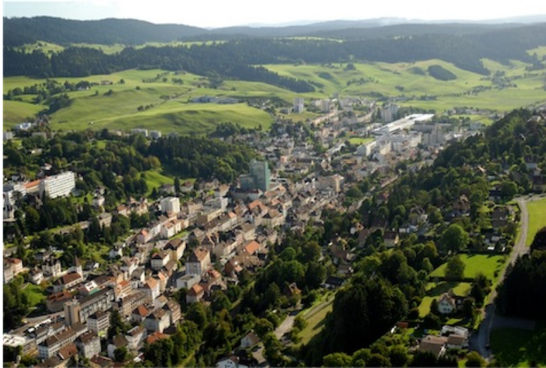
Vue du Locle, 2007.

La singularité formelle des deux villes, célébrée par l'inscription au Patrimoine mondial de l'Unesco, se matérialise dans l'organisation orthogonale de leur architecture, corrélative au développement local de l'industrie horlogère. A la fin du XVIIIème siècle, cette dernière était éclatée en une multiplicité d'ateliers concentrés dans les mêmes espaces que les habitations. Chacun de ces ateliers regroupait un corps de métier lié à la fabrication d'une partie spécifique de la montre. La mise en oeuvre progressive de cette architecture « en damier » visa, au cours du XIXème siècle, l'optimisation de la production horlogère en facilitant la circulation des composants et des montres entre les différents ateliers puis entre les nombreuses petites usines qui essaimèrent au coeur même des deux villes.