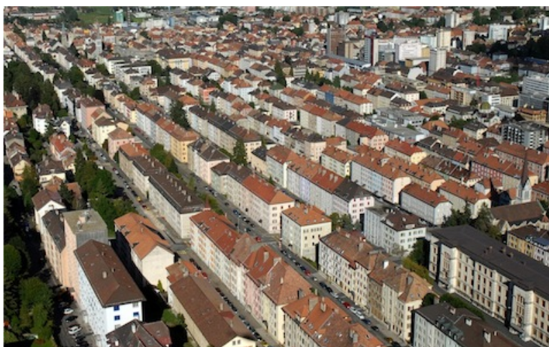
Vue de La Chaux-de-Fonds, 2007.

En se focalisant sur « la conservation de l'intégrité et de l'authenticité [du] tissu urbain ancien [de ces deux villes] ainsi que [sur] la continuité dans la tradition et l'innovation de leur industrie [...] » (Jeanneret, 2009 : 17), le comité de pilotage de la candidature (composé de délégués des deux villes, du Canton et de la Confédération suisse) travailla près de cinq ans à la constitution d'un dossier susceptible de démontrer que cet « urbanisme horloger [...] form[ait] un patrimoine exceptionnel à valeur universelle » (Jeanneret, 2009 : 17). En faisant valoir que La Chaux-de-Fonds et le Locle étaient des « exemples exceptionnels de symbiose entre industrie et urbanisme » et qu'elles avaient « été bâties au XIXe siècle par et pour l'horlogerie » ( http://www.urbanisme-horloger.ch/index.asp/3-0-10-8023-131-207-1/ ), le Comité œuvra à sensibiliser les milieux politiques, horlogers et la population de la région à la richesse de ce « patrimoine ». Il souligna, de plus, que « l'inscription de ces deux villes [...] offrirait une notoriété accrue à [leurs] industries de pointe, tant à la branche horlogère qu'à la microtechnique, toutes deux issues de la même tradition et des mêmes savoir-faire » ( http://www.urbanisme-horloger.ch/index.asp/3-0-10-8023-131-207-1/ )